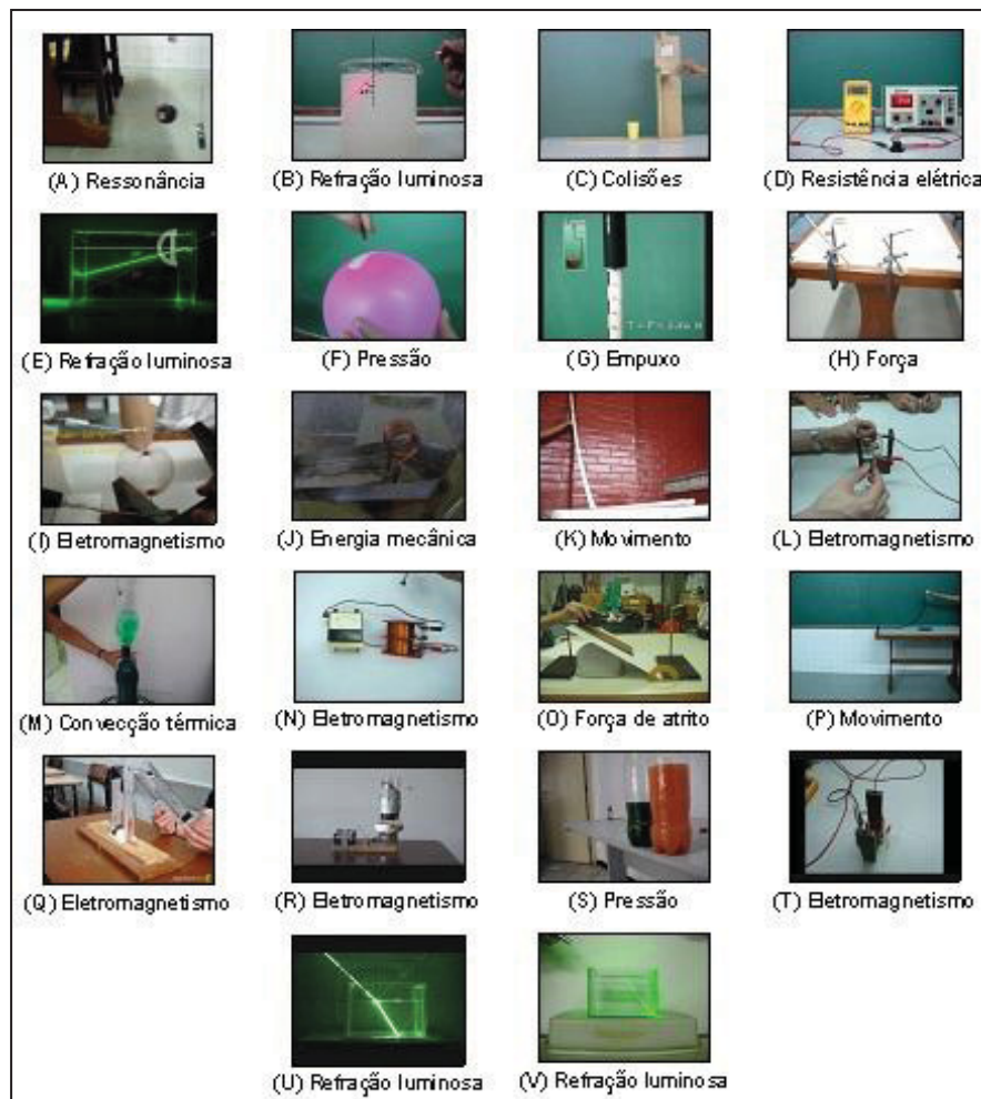
Fig. 2 – Imagens representativas dos vídeos produzidos.

A Fig. 2 mostra uma imagem representativa e o tema tratado em cada um dos vídeos, que, doravante, serão identificados pelas letras maiúsculas.