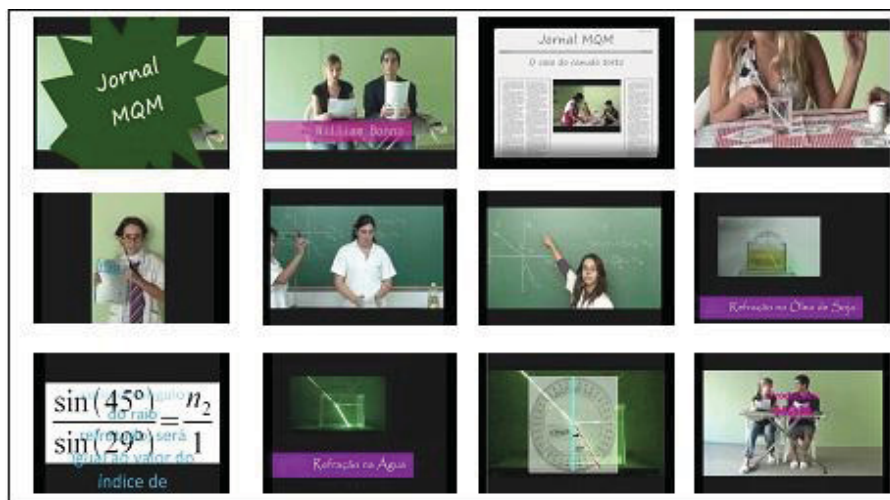
Fig. 4 – Imagens do vídeo U.