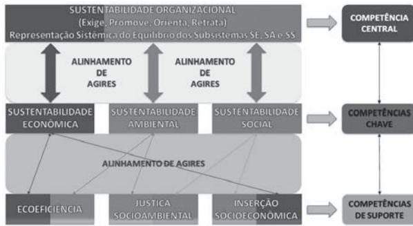
Figura 5: Framework representativo do acontecimento da Sustentabilidade Organizacional.