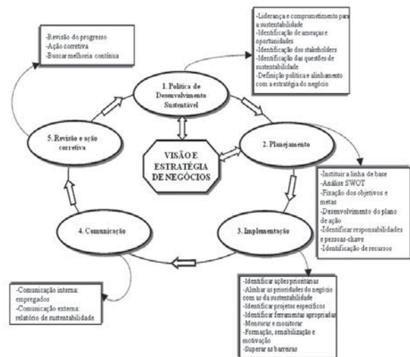
Figura 1: Sistema de gestão da sustentabilidade organizacional

liderança. Bem por isso há a necessidade de facilitar a convergência e a padronização de abordagens para a sua gestão, demonstrada por meio de um framework , apresentado na Figura 1. Segundo o autor, uma abordagem integrativa de gestão da SO pode alavancar inúmeras oportunidades para aprimorar a competitividade proporcionando soluções de valor agregado, e potencializar a reputação empresarial.