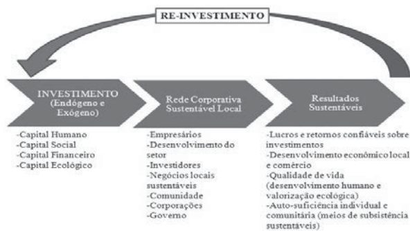
Figura 2: O modelo de Redes Corporativas Sustentáveis Locais (SLEN)

recursos ou o reinvestimento deve ocorrer para que a rede cresça e se torne independente. No modelo SLEN todos participantes concordam com o primeiro propósito da rede: a colaboração. Isto faz com que existam poucas agendas normativas e, conseqüentemente, não se oprima os participantes a nenhum constrangimento ideológico. O valor e os resultados obtidos por meio da rede diferem para cada participante conforme o que for considerado mais importante para ele. A Figura 2 representa o modelo.