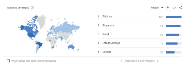
Figura 2 Interesse do termo 'Fake News' nos países ao longo do tempo

março de 2015, o Brasil figurou na terceira posição de interesse sobre o termo, como demonstrado na Figura 2, ocupando uma posição superior à dos Estados Unidos – mesmo com todo o escândalo envolvendo a eleição de Donald Trump e associando-a a presença de conteúdos falsos – e ficando atrás apenas das Filipinas e de Singapura.