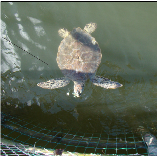
FIGURA 5: Tartaruga verde ( Chelonia mydas ) capturada por um cerco-fixo localizado na Ilha do Cardoso.

Devido à falta de trabalhos sobre essa temática na região estudada, os dados da Tabela 2 são as únicas informações a serem comparadas com os dados etnobiológicos obtidos pelo presente estudo. É necessário ressaltar que o monitoramento das praias e o acompanhamento das atividades pesqueiras não foram realizados de forma contínua, dependendo da disponibilidade dos pesquisadores, das condições climáticas e da colaboração dos pescadores.