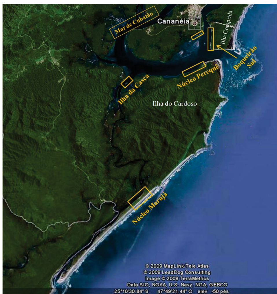
FIGURA 3: Localização das áreas onde os entrevistados construíram os cercos-fixos: Ilha da Casca Núcleo Marujá, Núcleo Perequê, Boqueirão Sul e Cananéia (Fonte: modificado do Google Earth).

Além disso, foi possível observar também que 38% dos pescadores diminuem o esforço de pesca na época de verão e assumem atividades voltadas para o turismo na região. Tal situação de enfraquecimento da pesca artesanal devido ao surgimento de outras possibilidades de trabalho mais rentáveis, principalmente atividades econômicas ligadas ao turismo local, é igualmente relatada por Cardoso (2004) em seu trabalho realizado na Ilha do Cardoso e por Diegues (2004) em outras localidades do litoral do estado de São Paulo.