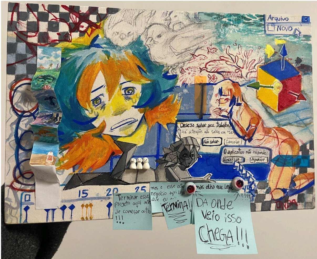
Título: Sem Título Artista: Onda