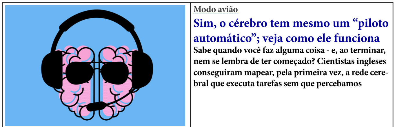
Figura 4 – “Chamada” de notícia de popularização da ciência, publicada no sítio eletrônico da revista Superinteressante