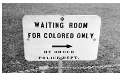
Figura 1 - Placa de sinalização oficial “sala de espera apenas para negros”

Nesses termos, o discurso racista bem como as identidades e relações sociais associadas a ele podem ser atualizados em gêneros discursivos tão variados como uma placa de sinalização (Figura 1) ou um anúncio de emprego (Figura 2).