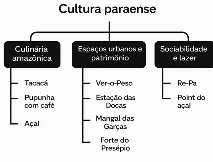
Figura 1 – Estrutura hierárquica do domínio conceitual da música “Voando pro Pará”

Além disso, observa-se a presença de relações associativas que aproximam termos de diferentes grupos, indicando como práticas alimentares, lugares e eventos culturais se entrelaçam no cotidiano regional. Dessa forma, delinea-se um sistema conceitual no qual cada termo ocupa posição definida e, simultaneamente, mantém vínculos com os demais, contribuindo para a coerência do domínio “Cultura popular paraense”. A estrutura apresentada na Figura 1, corresponde a um sistema terminológico parcial de representação do conhecimento, resultante do recorte analítico aplicado ao corpus da música.