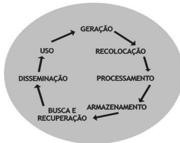
Figura 1: Ciclo da informação, Rojas (2006)

Ao desenharmos o ciclo percorrido pela informação em meio à rede NGO , a partir do ciclo da informação proposto por Rojas, observamos a seguinte configuração: