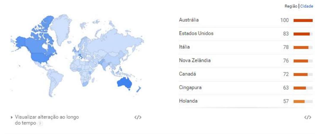
Figura 1. Interesse de busca pelo termo “privacidade” com o passar do tempo.