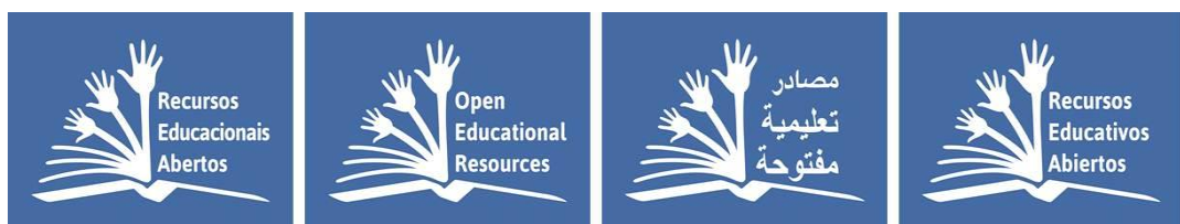
Figura 2: Logotipo do movimento REA.

O movimento em favor dos recursos educacionais abertos é representado por um logotipo global (vide figura 2) desenhado por Jonathas Mello em parceria com a UNESCO e apresentado no Congresso REA de Paris de 2012. O logotipo que pode ser adaptado em todas as línguas representa, segundo a UNESCO os ideais e objetivos dos REA.