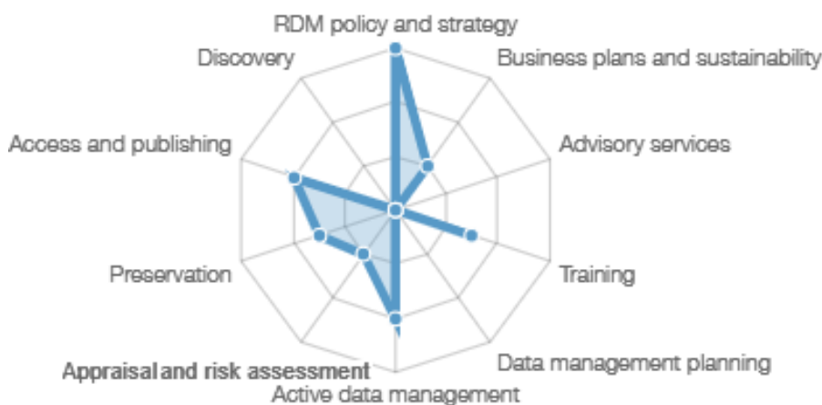
Gráfico 2 – Serviços Personalizados de Gestão de Dados de Pesquisa na Unesp

O Gráfico 2 é utilizado para representar o grau em que a instituição adapta a gestão de dados de pesquisa às necessidades de seus usuários. No que tange à Unesp, reforçando o que foi constatado no Gráfico 1, o Gráfico 2 evidencia a presença de política e estratégia de gestão de dados de pesquisa, o gerenciamento de dados ativos e o acesso e publicação. Sendo o último aspecto relacionado à disponibilidade de ambiente informacional para a disponibilização e ampla disseminação dos dados de pesquisa proveniente das investigações realizadas na Instituição, o Repositório Institucional da Unesp. Embora haja convergência com a análise anterior, é possível verificar que a representação gráfica da personalização dos serviços possui ramificação menor, mantendo todos os aspectos mais próximos do elemento central.