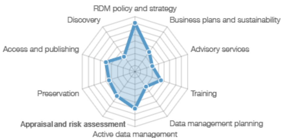
Gráfico 1 – Oferta e Gestão de Dados de Pesquisa na Unesp

O Gráfico 1 objetiva apresentar a oferta e a gestão de dados de pesquisa, sinalizando a variedade de políticas, suporte e serviços que a instituição oferece. No caso da Unesp, o gráfico evidencia a presença de política e estratégia de gestão de dados de pesquisa e o gerenciamento ativo de dados, fator decorrente do processo de implantação da Política de Acesso Aberto à Produção Intelectual da Unesp, aprovada pelo Conselho Universitário, por meio da Resolução Unesp-8, de 4-2-2021 3 .