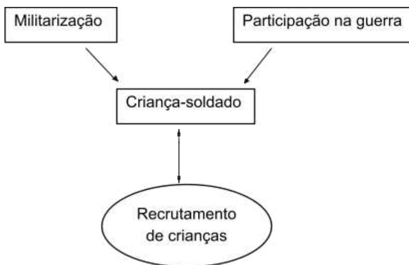
Figura 1 – Militarização, criança-soldado e o recrutamento de crianças