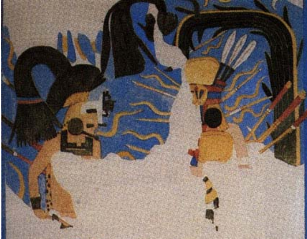
FIGURA 1. La divinidad Kukulcán aparece en el lado derecho de la imagen. Por su detrás aparece la serpiente emplumada. Templo superior de los Jaguares, Chichén Itzá.

Investigamos tres diccionarios de la lengua maya para entender con mayor claridad sus acepciones y relaciones con el personaje así nombrado. En el Calepino de Motul , organizado por Ramón Arzápalo Marín, encontramos las siguientes palabras o combinaciones: a la partícula ku se le da el siguiente significado: