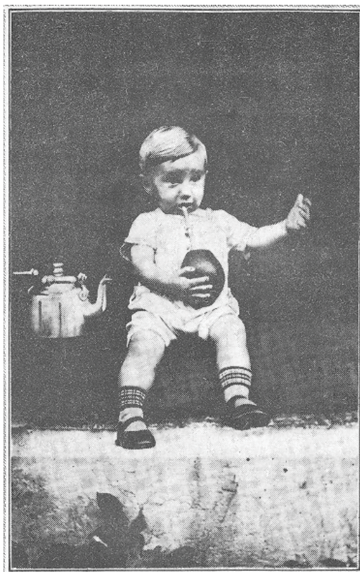
Figura 5 – O pequeno tomador de mate.

Esta fotografia seguramente é uma composição de pessoas adultas para agradar aos olhos de outros adultos. Ela foi enviada por Albino Krüger, da Colônia Serro Azul (hoje Cerro Largo) e venceu o concurso promovido pelo Kalender der Serra-Post em 1932, que a ofereceu como brinde aos leitores. A imagem expressa a valorização do mate enquanto uma bebida incorporada ao cotidiano de uma parcela dos colonos. 60