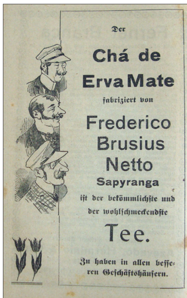
Figura 6 - Chá de erva-mate. Fonte: Kalender für die Deutschen in Brasilien , 1913.

No jornal Correio Serrano , impresso em alemão e depois também em língua portuguesa, que circulou por cerca de 70 anos no Norte do estado, se pode encontrar anúncios de “Terras com Herval: Vende-se junto a villa Ijuhy 10 kilometros da estação da viação ferrea seis colonias de 25 ha com 12 a 15 mil pés de herva mate especial sendo oito mil pés em franca produção”. 63 Nele encontra-se ainda oferta de “5 ½ colonias: com matto e campo, situadas no melhor ponto do 3º distrito do Municipio de Ijuhy; com um bonito herval que rende até 1.000 arrobas de herva por colheita; tem tres bonitas cachoeiras sobre o rio Fachinal...” 64 No primeiro anúncio transcrito, possivelmente o erval ofertado era cultivado e não nativo. Deduz-se isso do procedimento de contagem das plantas (difícil de ser feito em meio à floresta, onde as árvores não têm a regularidade e a distribuição em linhas típicas do cultivo) e da informação de que parte delas não estava produzindo, talvez porque eram jovens. Próximo