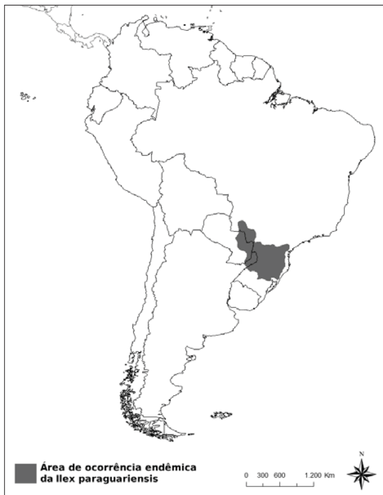
Figura 1 - Área de ocorrência endêmica da Ilex paraguariensis . Elaborado a partir de LINHARES, Temístocles. História econômica do mate . Rio de Janeiro: José Olympio Editora, 1969.

de Misiones na Argentina e ao Leste do Paraguai, representada parcialmente na Figura 1.