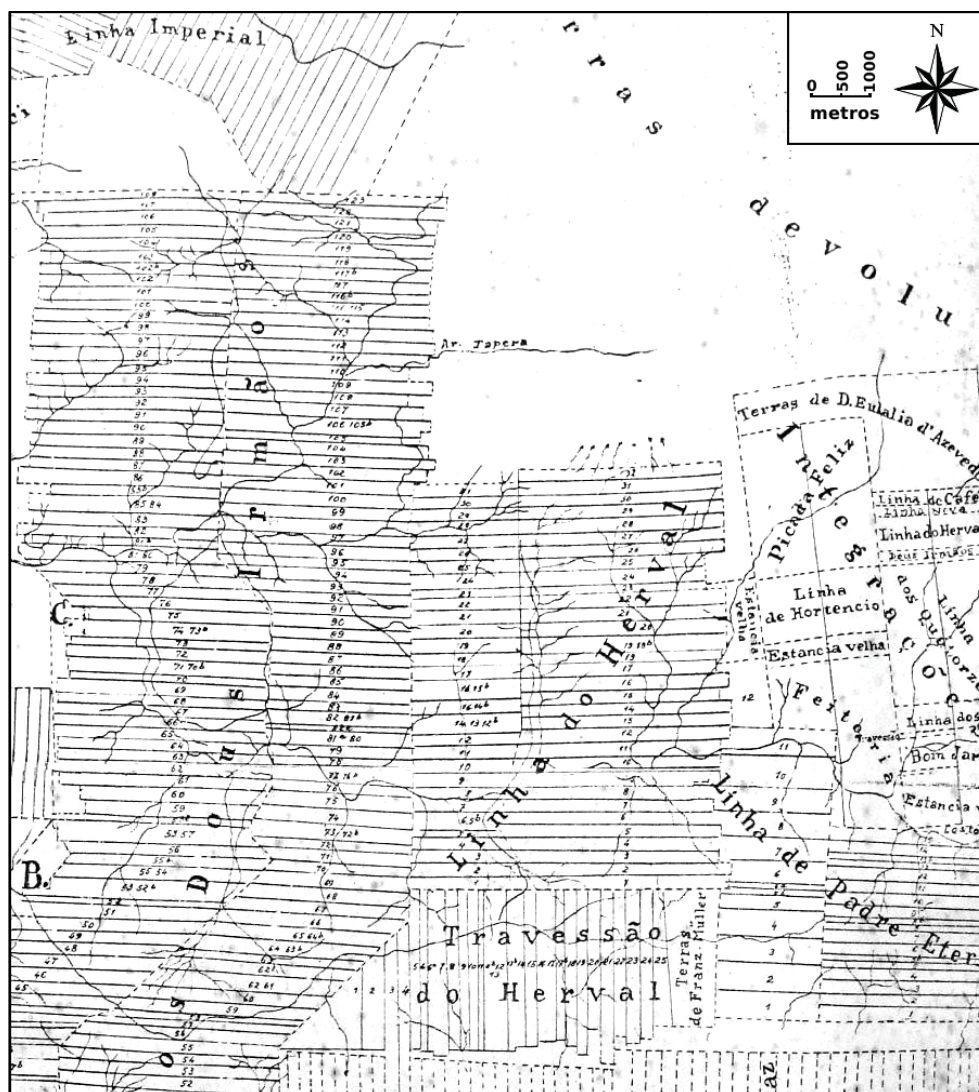
Figura 4 – Fragmento de Planta da Colônia São Leopoldo. Fonte: MÜZELL, Ernst; JAHN, Adalbert. Planta topográfica de uma parte do município de São Leopoldo, 1870. Arquivo Público do Rio Grande do Sul.

Em Santa Cruz, um núcleo colonial criado na metade do século XIX, a imigração dirigiu-se para áreas florestais onde a Ilex era abundante: um documento de 1853, informando aos vereadores da Câmara Municipal de Taquari sobre a dificuldade de abrir uma estrada deste município até Cruz Alta, também informou às autoridades sobre a existência de “grande erval rico em quantidade de excelente erva matte” e de ervateiros trabalhando nele. 29 A toponímia é fonte de informação, pois inclui localidades rurais como “Herveiras”, “Herval de Baixo”, 30 “Pinhal do Herval”, “Herval de São João” e “Herval do Paredão”. 31 Cristiano Christillino mostrou como terras cobertas