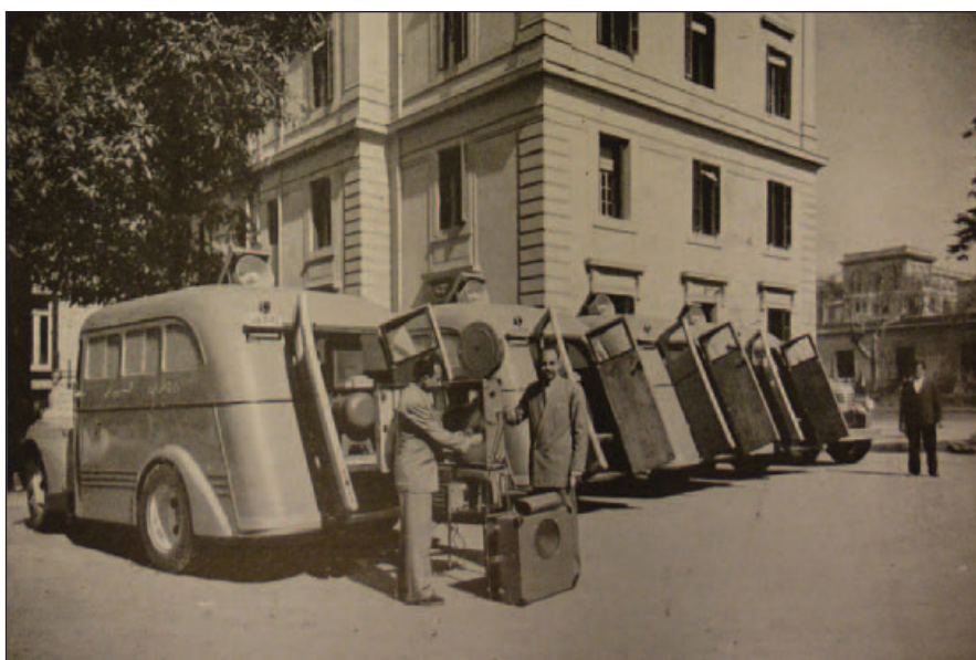
Figura 01 - Grupos Móveis de 16 mm e 35 mm pertencentes à seção de propaganda para a higiene do Ministério Egípcio de Saúde Pública. 23

Além da formação de técnicos, outras ações na África foram desenvolvidas em relação ao cinema. A UNESCO, em 1949, fomentou o emprego de grupos móveis equipados com projetores de películas e de diapositivos, gramofones, instrumentos de gravação, aparatos de receptores de rádio, microfones, amplificadores, especialmente nos países com elevada proporção de analfabetos.