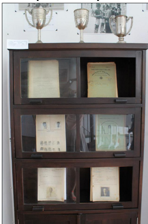
Figura 5 - Bloco II. Troféus e prontuários expostos