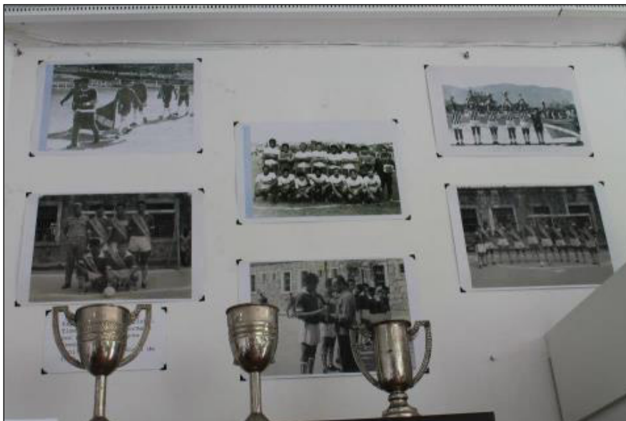
Figura 4 - Bloco II. Troféus e fotografias dos torneios de futebol