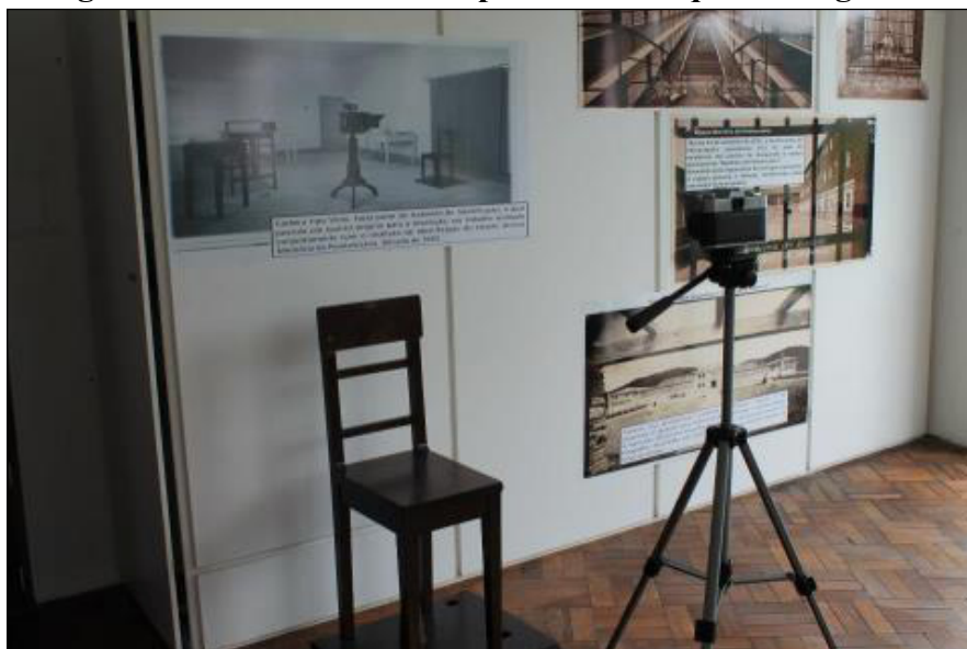
Figura 2 - Bloco I. Cadeira tipo Viola e máquina fotográfica