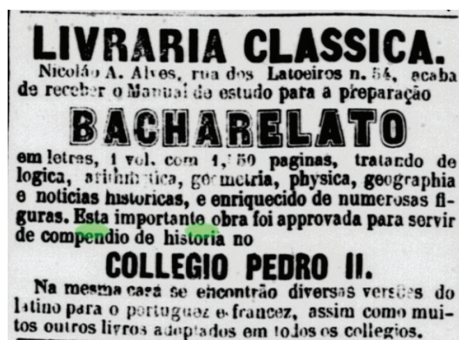
Imagem 2 – Anúncio do compêndio de história adotado pelo ICPII a partir de 1855