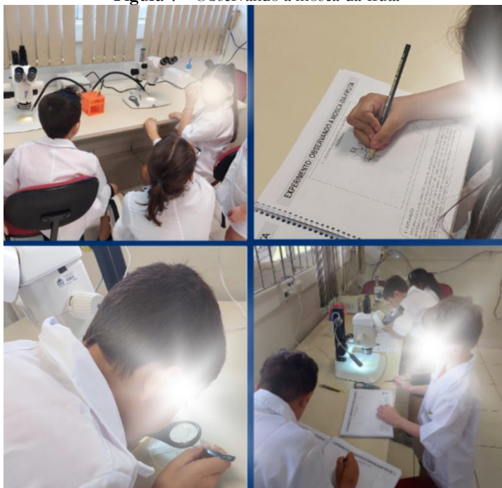
Figura 4 – Observando a mosca-da-fruta

Legenda: Pequenos grandes cientistas observando e desenhando a mosca-da-fruta.