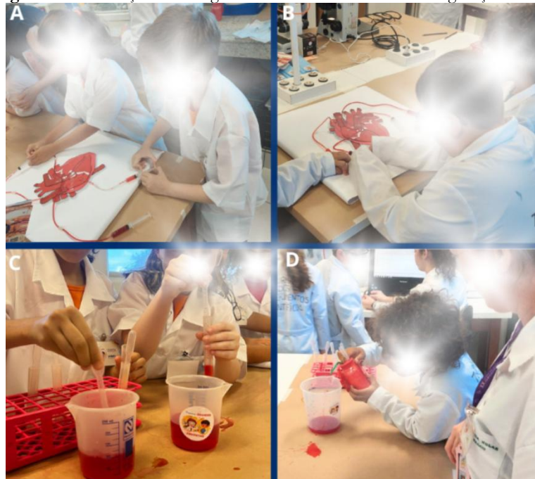
Figura 5 – Introdução à fisiologia do sistema cardiovascular e oxigenação celular

Legenda: A) e B): Pequenos grandes cientistas manuseando uma maquete tridimensional do sistema cardiovascular. O modelo apresenta as principais estruturas anatômicas, incluindo câmaras cardíacas e principais vasos. C) e D): Modelo funcional educativo que reproduz a dinâmica do bombeamento cardíaco, destacando a ejeção do volume sistólico pelo ventrículo esquerdo após a contração cardíaca.