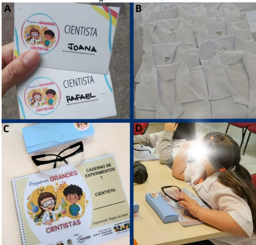
Figura 1 – “Kit cientista”

Legenda: A) Crachá utilizado pelos pequenos grandes cientistas; B) Jaleco disponibilizado para as crianças realizarem os experimentos; C) Caderno de experimentos, óculos de proteção e estojo; D) Uma pequena grande cientista utilizando o “kit cientista”.