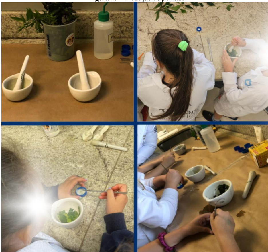
Figura 10 – Produção de pomada

Legenda: Pequenos grandes cientistas confeccionando suas próprias pomadas.