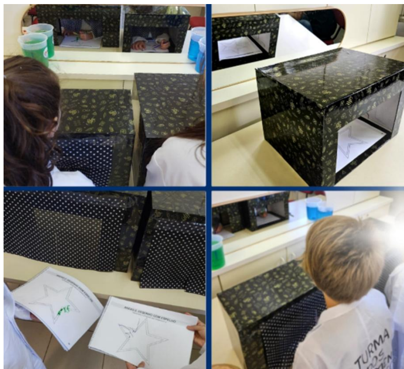
Figura 3 – Desenho com espelho

Legenda: Pequenos grandes cientistas desenhando a estrela apenas com o reflexo do espelho.