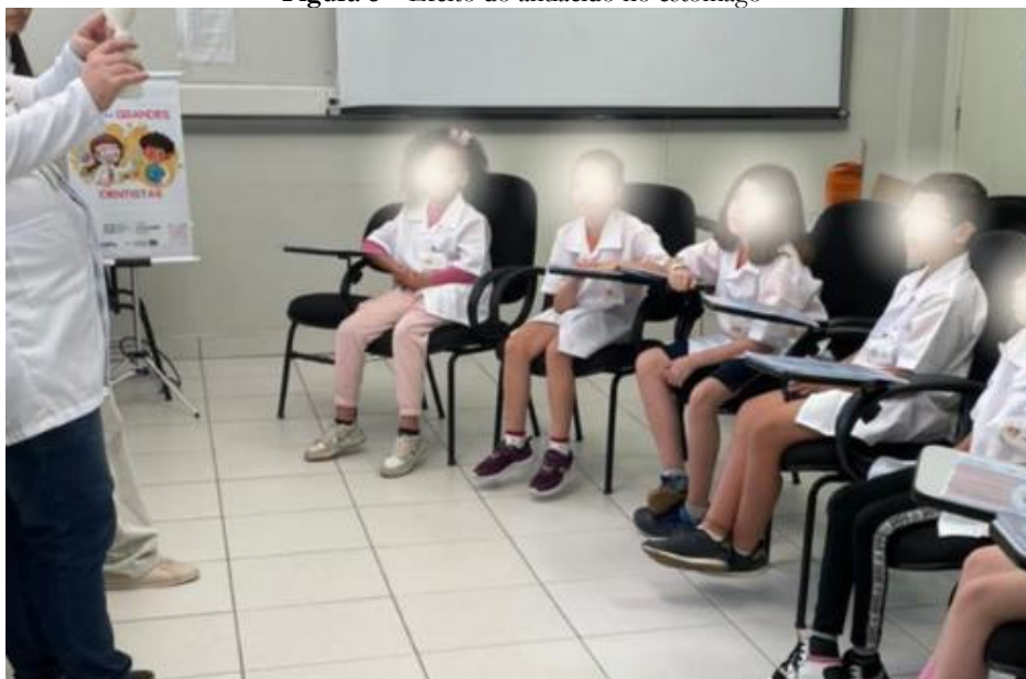
Figura 8 – Efeito do antiácido no estômago

Legenda: Cientista demonstrando o experimento do antiácido no estômago para um grupo de pequenos grandes cientistas.