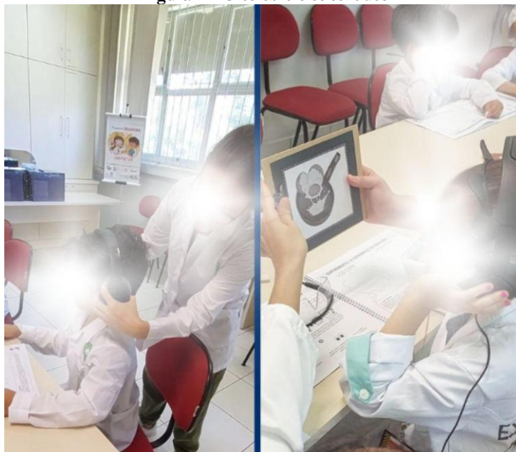
Figura 2 – O cérebro e os sentidos

Legenda: Pequenos grandes cientistas aprendendo sobre o cérebro e os sentidos.