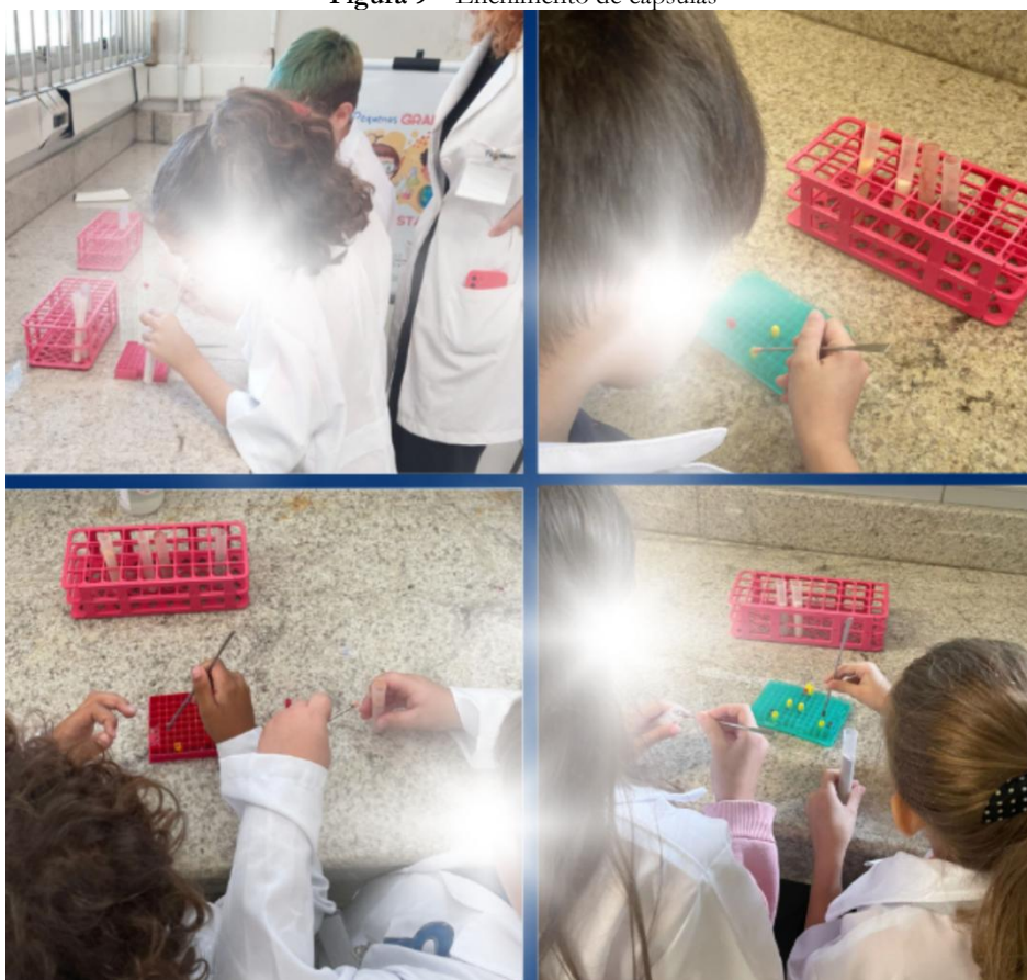
Figura 9 – Enchimento de cápsulas

Legenda: Pequenos grandes cientistas confeccionando suas próprias cápsulas.