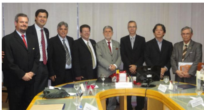
Fig. 2. Encontro com o Ministro da Defesa Sr. Celso Amorim, 2011