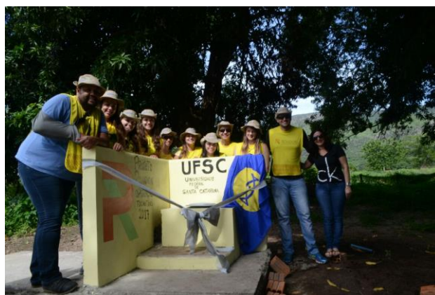
Fig. 5. Rondonistas da UFSC na entrega do Banheiro Seco no Colégio Agropecuário em Natividade-TO

Algumas atividades realizadas em operações do Rondon puderam ser devidamente mensuradas, como por exemplo, o caso aplicação da oficina “Banheiro Seco” em um Colégio Agrícola na cidade de Natividade-TO dentro da operação Tocantins em janeiro de 2017. Esta atividade foi considerada de grande multiplicidade pois sua implantação foi voltada para os professores do colégio e passou a fazer parte da disciplina “Construções Rurais” com diversas considerações da difusão desta tecnologia com uso de matérias primas de baixo custo disponíveis na região. Esta atividade, além de receber grande repercussão dos meios de comunicação locais durante a sua realização, foi premiada no III Congresso Nacional do Projeto Rondon (III CONGRESSO NACIONAL DO PROJETO RONDON, 2018), realizado em Brasília-DF em 2017. (Figura 5)