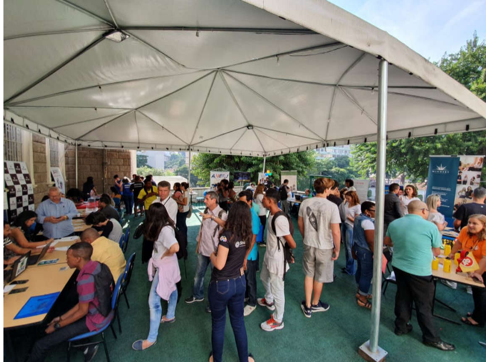
Figura 2: interessados circulam por um dos ambientes da feira no primeiro horário da manhã do dia 30 de maio de 2019.

A maioria dos participantes tomou conhecimento do evento através da publicação dos jornais, seguido das redes sociais e em terceiro por amigos. O objetivo com essa pergunta era ter ciência sobre quais as estratégias de divulgação precisariam ser feitas em caso de uma próxima feira. Segundo os dados coletados, 402 respondentes disseram que souberam da feira pelos jornais. 328 afirmaram que foi pelas redes sociais, e 247 que parentes e ou amigos informaram-lhes sobre a feira.