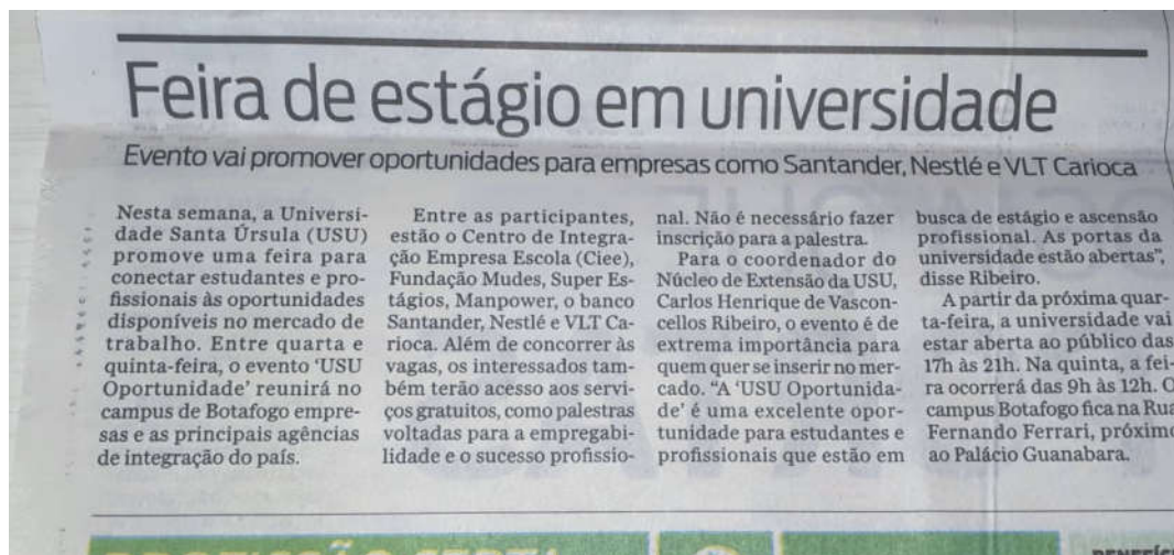
Figura 3: Jornal Extra, 26 de maio de 2019.

A Universidade disponibilizou em suas redes sociais a divulgação do evento, desde o início do mês de maio, bem como no seu site. Além disso, a feira também foi divulgada pelo aplicativo de troca de mensagens, o WhatsApp.