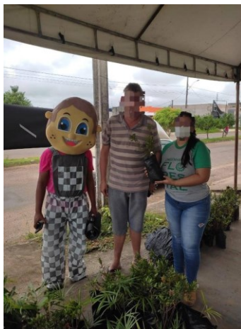
Figura 02 – Distribuição de mudas em ações solidárias. disponibilizada pelo município de Ji-Paraná.