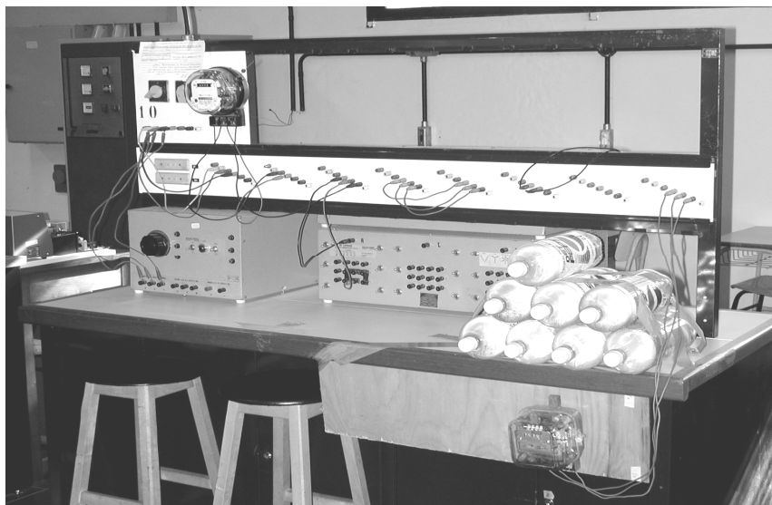
Fig. 2 - Aspecto da montagem experimental.

Durante os dois meses iniciais, os contadores foram mantidos medindo a energia consumida pela carga ininterruptamente, sem nenhuma garrafa de água nas suas proximidades. Ao final deste período foi possível determinar que havia uma divergência intrínseca de 4,8% entre a indicação de um e de outro contador, com uma incerteza próxima a 0,2% (tabela I). As leituras parciais permitiram avaliar a estabilidade da divergência de indicação entre os contadores, mostrando que, em todas as leituras, houve manutenção dessa discordância, desde que considerados os erros de aproximação na indicação. Esta correção, que deveria ser sempre aplicada a qualquer medição envolvendo os dois contadores, revelou-se um excelente exemplo de erro sistemático, ajudando a fixar os conceitos relativos à determinação da incerteza de medições em geral, um dos assuntos programáticos que trabalhamos.