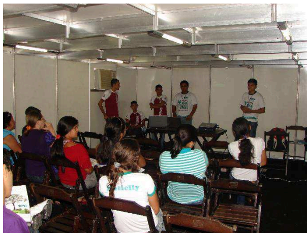
Fig. 4 – Palestra realizada no Centro de Eventos Arena, localizado no Município de Capanema/PA (município com cerca de 65 mil habitantes, situado a aproximadamente 160 quilômetros de Belém), em 19 de maio de 2010.

Com a estruturação das conexões entre a universidade e a escola, outro aspecto digno de destaque é a (re)aproximação do docente da rede básica com o núcleo acadêmico. Estabe-