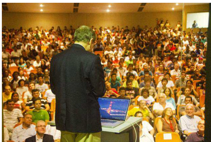
Fig. 02 – Douglas Dean Osheroff, ganhador do Prêmio Nobel de Física de 1996, ministrando palestra diante de cerca de mil pessoas, no Centro de Eventos Benedito Nunes, no Campus de Belém da Universidade Federal do Pará, em 10 de junho de 2011.

As palestras de maior destaque organizadas pelo FISESCOLA/UFPA, em parceria com o Programa de Pós-Graduação em Física da UFPA (PPGF/UFPA) e outras instituições, foram realizadas por cientistas ganhadores do Prêmio Nobel em Física, contando com tradução simultânea, atingindo um público de aproximadamente 1000 pessoas cada. Os professores Douglas Dean Osheroff (Ganhador do Prêmio Nobel de Física de 1996), ministrando a palestra sobre “Como avanços em Ciências são feitos” (Fig. 2), e Klaus von Klitzing (Ganhador do Prêmio Nobel de Física de 1985), com a palestra “Quanto mede 1 metro” (Fig. 3), reuniram um público de diversos níveis de escolaridade no Centro de Eventos Benedito Nunes na Cidade Universitária José da Silveira Netto, em Belém/PA.