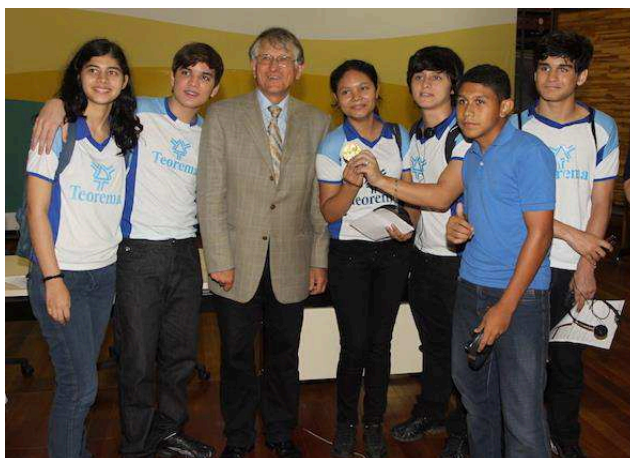
Fig. 3 – Estudantes com o ganhador do Prêmio Nobel de Física, Klaus von Klitzing, após palestra realizada em Belém, em 03 de outubro de 2011. Observa-se dois dos estudantes segurando a medalha associada ao Prêmio Nobel de 1985, de Klitzing.

pública da educação básica, estudantes universitários orientavam professores na utilização de programas para simulação de experimentos de Física como, por exemplo, o Algodo (AL-GODOO, 2018) (Fig. 4).