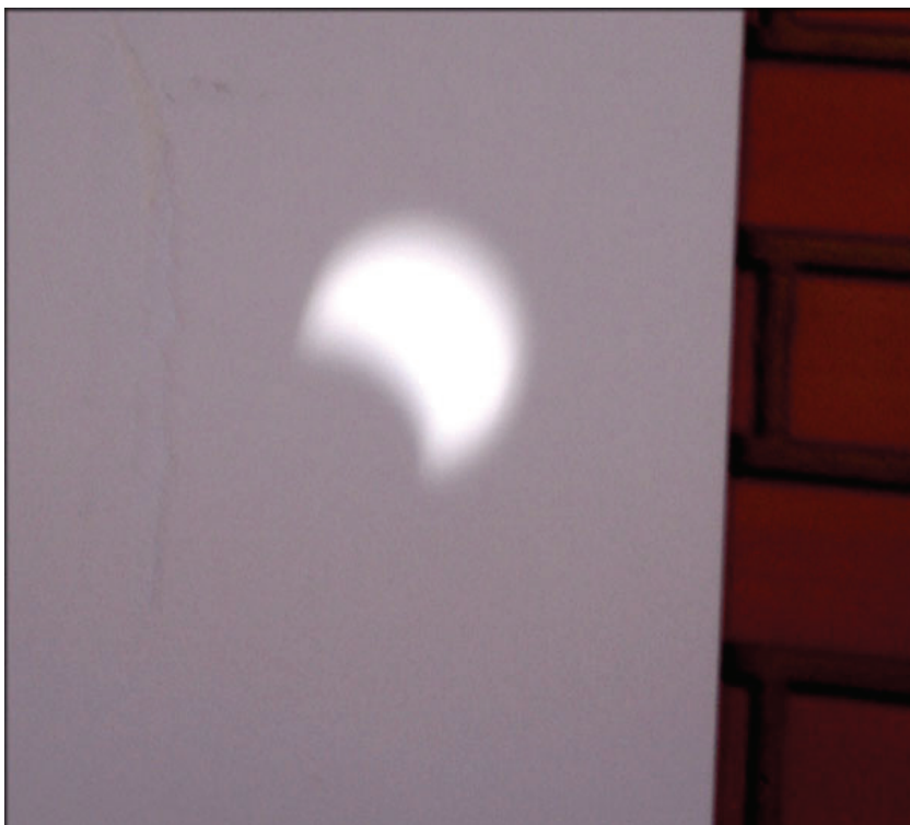
Fig. 4 - Imagem do Sol eclipsado obtida com um espelho plano durante o eclipse de 11/09/2007 em Porto Alegre.

do. A observação do eclipse também pode ser realizada pela reflexão da luz solar com um espelho plano, conseguindo-se imagens grandes e nítidas do Sol em anteparos distantes.