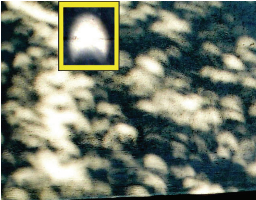
Fig. 2 – Miríade de imagens do disco solar eclipsado sobre uma parede.

Durante os eclipses do Sol, as manchas luminosas produzidas pela luz que se infiltra através das folhas da vegetação e incide no chão ou nas paredes distantes das folhas, se apresentarão com a forma do disco solar eclipsado. Este belo efeito foi registrado durante o eclipse parcial do Sol em 11 de setembro de 2007 em Porto Alegre. A Fig. 2 é uma fotografia de uma miríade de imagens em uma parede próxima a uma árvore, obtida durante o eclipse. No topo da Fig. 2, à esquerda, esta sobreposta uma imagem isolada do disco solar, fotografada em outra parede.