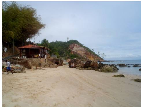
Foto 2: Presença de falésias em Morro de São Paulo, Ilha de Tinharé.

Este segmento corresponde às Ilhas de Tinharé e Boipeba e apresenta características bastante diversificadas. A configuração da linha de costa nestas ilhas é bastante condicionada pela presença das rochas da Bacia de Camamu. Em muitos locais, ao longo deste segmento, estas rochas formam falésias ativas que condicionam o uso e o cenário das praias (Foto 2).