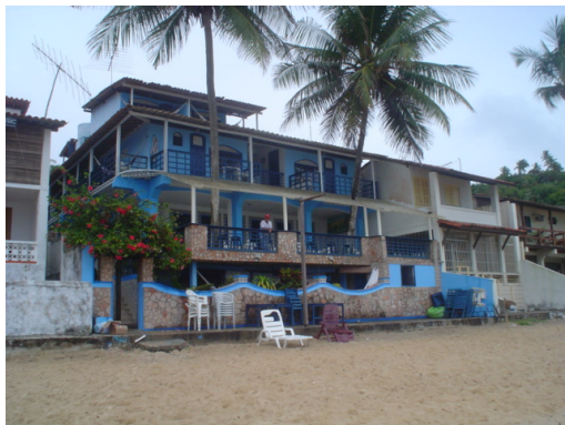
Foto 4: Construções à beira-mar em Morro de São Paulo, Ilha de Tinharé.

Um outro problema ambiental observado nestas praias está associado à ocupação das áreas de mangue. Muitas vezes estas áreas são usadas como depósitos de lixo, gerando risco de contaminação para os ecossistemas costeiros.