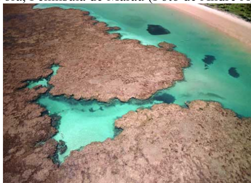
Foto 6: Piscinas naturais geradas pelos recifes de corais em Taipus de Fora, Península de Marajú.

As praias deste segmento apresentam características morfodinâmicas diversificadas nos trechos onde ocorrem recifes de corais ou onde estes estão ausentes. Desta forma, as praias apresentam sedimentos com granulometria variando de areia fina a grossa, as declividades variam de 2 a 10° e as larguras variam predominantemente de 5 a 40 m. A altura das ondas na praia também varia bastante, sendo que nos trechos protegidos pelos recifes em geral não ocorre quebra de ondas na face da praia.