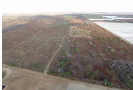
Fase 02 - Desmatamento para construção de acessos