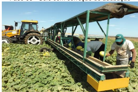
Fase 07 - Colaboradores na colheita da produção