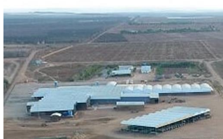
Fase 08 – Infraestrutura do armazenamento da produção