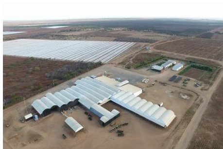
Fase 01 - Pressão nas comunidades locais