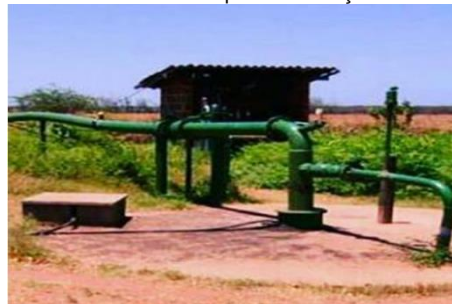
Fase 04 - Sistema de irrigação