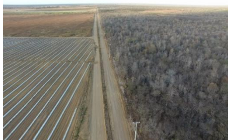
Fase 03 - Plantio de melão (esquerda) e caatinga (direita)