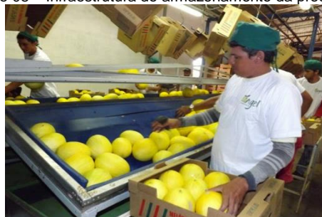
Fase 10 – Produtos para comercialização