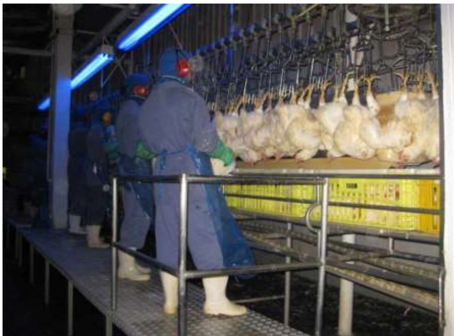
Figura 1. Trabalhadores no setor de recepção de aves na agroindústria Diplomata