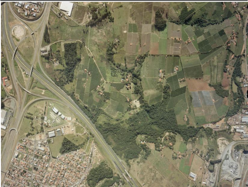
FIGURA 3: Trecho do de área periurbana próxima ao Reforma Agrária em Campinas em 2006

Vê-se à direita abaixo, atividade mineradora e galpões industriais e à esquerda cruzamento entre rodovias dos Bandeirantes e Santos Dumont, com loteamentos populares e indústrias.