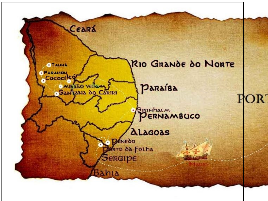
Mapa 02: Provável trajeto dos primeiros membros da família Feitosa.

A família Feitosa é descendente do português João Alves (ou Álvares) Feitosa, que chegou ao Brasil pelo estado de Sergipe na primeira metade do século XVII e seguiu para Penedo no estado de Alagoas fixando-se em Serinhaém no estado de Pernambuco. (Mapa 02).