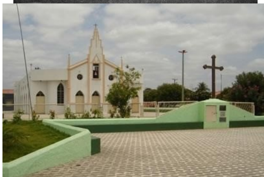
Figuras 03 e 04: Vista externa da Igreja Matriz de São Pedro. Localidade: Sede do Município de Parambu.

Fonte: Arquivo da Família Feitosa e pesquisa de campo (ano de 1970 e novembro de 2013 respectivamente).