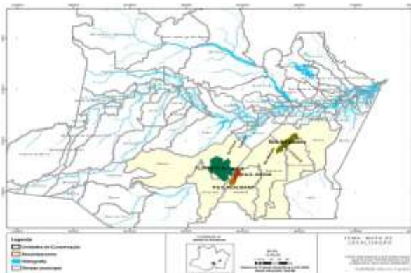
Figura 01: Área de estudo

O estudo foi desenvolvido em dois projetos de assentamento, um da modalidade PAE – Projeto de Assentamento Agroextrativista Botos e outro da modalidade PDS – Projeto de Desenvolvimento Sustentável Realidade, e duas Unidades de Conservação (UCs) de Uso Sustentável, uma da categoria RDS – Reserva de Desenvolvimento Sustentável do Rio Madeira e outra Floresta Estadual – Floresta Estadual Tapauá. As áreas localizam-se na região Sul do Estado do Amazonas, abrangendo os municípios de Humaitá, Manicoré, Novo Aripuanã, Borba, Tapauá e Canutama (figura 01).