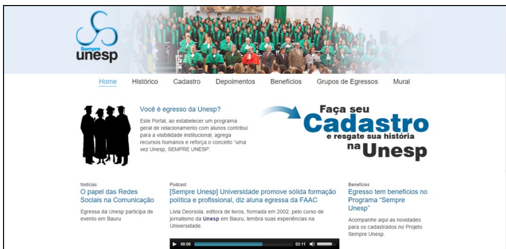
Figura 2 Página inicial do portal de egressos da UNESP.

A página inicial do portal de egressos da UNESP é bastante atraente. O site proporciona o acesso ao portal principal da Instituição, bem como à Agência de Notícias da IES. Os menus “Home”, “Histórico”, “Cadastro”, “Depoimentos”, “Benefícios”, “Grupos de Egressos” e “Mural” são facilmente visualizados e apresentam informações importantes, como o objetivo do portal, testemunhos de ex-alunos, as vantagens em se cadastrar na plataforma, alguns círculos de egressos existentes, com seus respectivos contatos, e um mural (ainda pouco utilizado) para que os usuários deixem seus recados (UNESP, 2016b). A Figura 2 apresenta a página inicial do portal de egressos da UNESP.