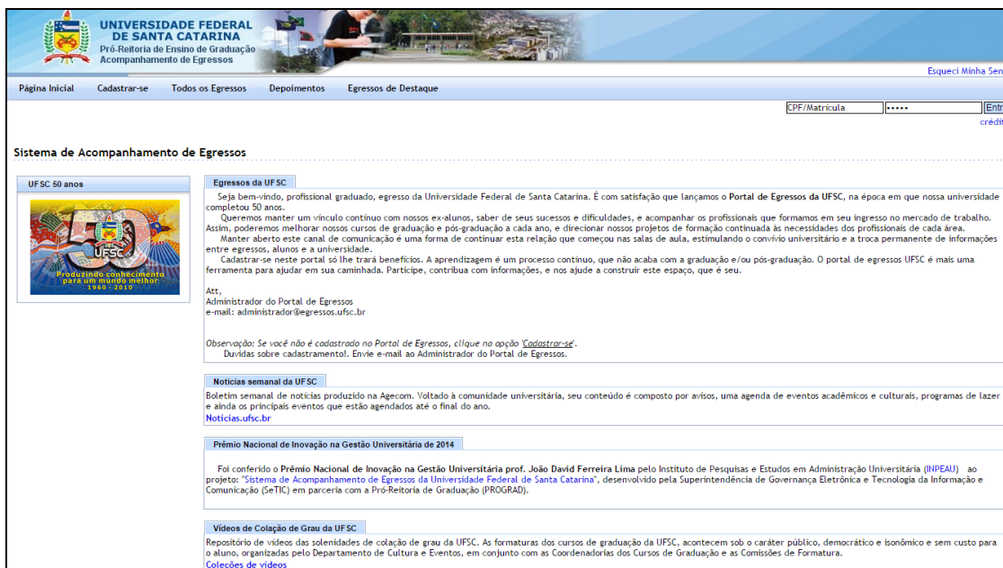
Figura 3 Página inicial do portal de egressos da UFSC.

Por fim, o portal também disponibiliza informações a respeito de egressos destaque, tendo apenas um egresso que pode ser visualizado nesta página. A Figura 3 apresenta a pagina inicial do portal de egressos da UFSC.