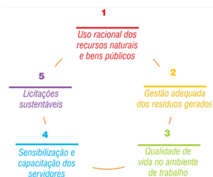
Figura 3 Eixos temáticos da A3P