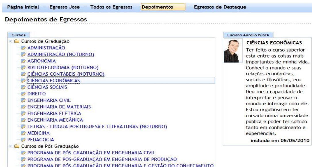
Figura 5 – Publicação dos depoimentos dos egressos

Além das telas apresentadas, o administrador do Sistema de Acompanhamento dos Egressos tem acesso às análises dos questionários coletados, dos e-mails enviados sobre ocorrências demandadas pelos egressos, assim como outras situações não previstas.