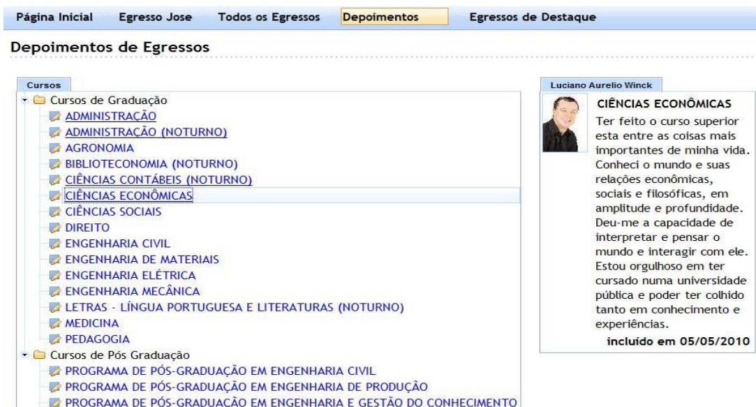
Figura 5 –Publicação dos depoimentos dos egressos

Além das telas apresentadas, o administrador do Sistema de Acompanhamento dos Egressos tem acesso às análises dos questionários coletados, dos e-mails enviados sobre ocorrências demandadas pelos egressos, assim como outras situações não previstas.