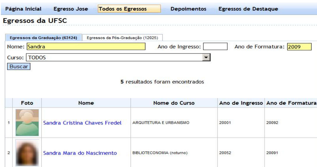
Figura 3 – Consultas aos egressos da instituição

Na tela mostrada na Figura 4 – Consulta pública aos egressos da instituição , são publicados, para a sociedade, todos os graduados da instituição formados entre o ano de 1970 até a data atual, e os pós-graduados entre os anos de 2000 até a data atual. Através das especificações de parâmetros de consulta, são mostrados os egressos da instituição cadastrados nos Sistemas Acadêmicos.