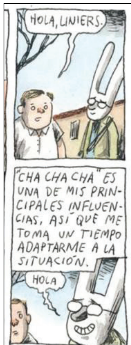
Figura 13 – Autoconsciência do narrador na entrevista com Alfredo Casero.