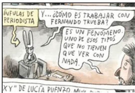
Figura 14 – Autoanálise do narrador na entrevista com Ricardo Darín (1).

Esta característica pode ser derivada da autoconsciência do entrevistador, que faz com que Liniers brinque com suas próprias atitudes durante as entrevistas. Seguem dois exemplos de observações marcadas em amarelo e feitas com base na autoanálise, ambos na entrevista feita com Darín.