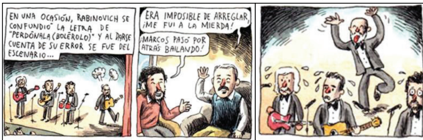
Figura 3 – Recriação de cenas na entrevista com Les Luthiers (à esquerda). Figura 4 – Recriação de cenas na entrevista com Les Luthiers (à direita).

Nesta sequência da conversa com Les Luthiers, Liniers alterna a reconstrução de uma história de apresentação contada pelo grupo humorístico com o diálogo mantido durante a entrevista. Segundo Medina (1986 p. 43, grifo da autora),