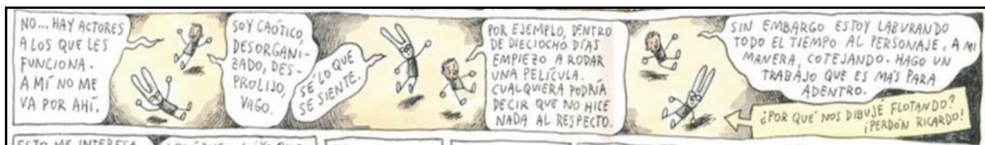
Figura 6 – Empatia na entrevista com Ricardo Darín.

Liniers utiliza os recordatórios – caixas de texto que acompanham os quadrinhos