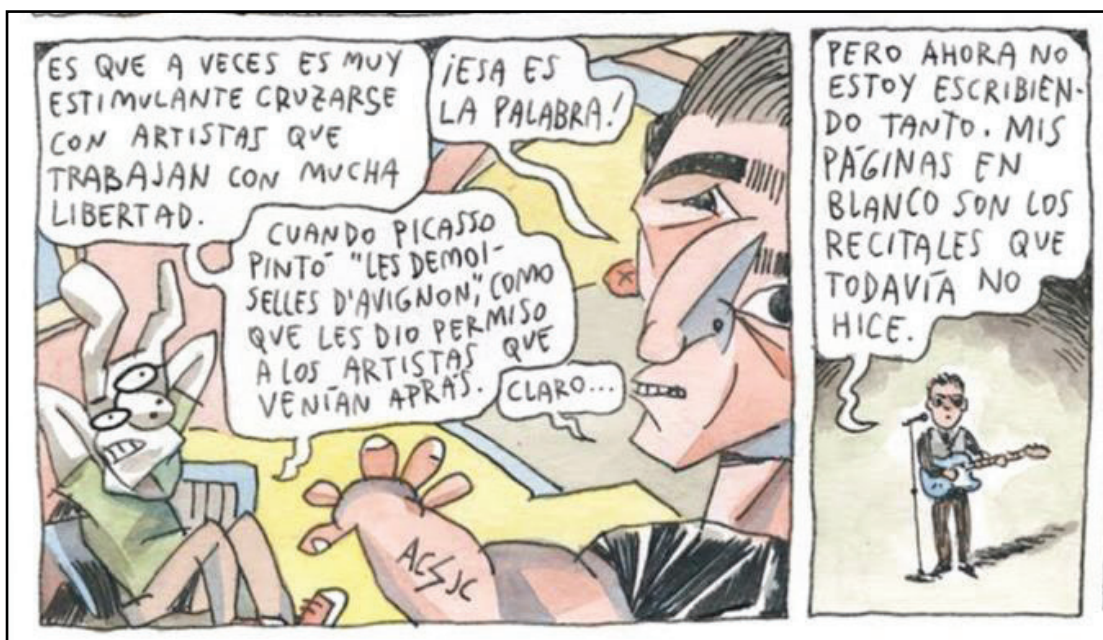
Figura 10 – Metáfora visual na entrevista com Jorge Drexler.

o cantor sente que foi influenciado por ter passado pela medicina. Na resposta, Drexler diz que adquiriu uma maneira de perceber a realidade que é qualquer coisa menos neutra e, então, explica como pensa no som chegando a um ouvido. Para representar isso, o quadrinista optou por uma metáfora.