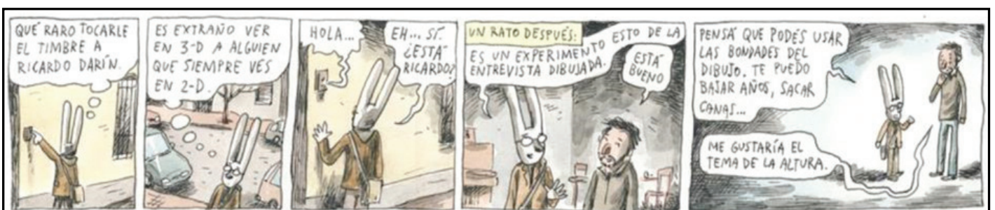
Figura 1 - Detalhamento do processo da entrevista com Ricardo Darín.

O quadrinista brinca com duas dimensões nos desenhos de suas entrevistas. A real, ao reproduzir como as conversas transcorreram; e a imaginária, ao recriar cenas contadas pelos