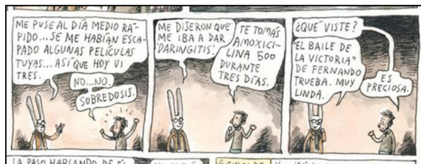
Figura 5 – Conversa aberta na entrevista com Ricardo Darín.

sabor de um diálogo fluente, desarmado, que já aconteceu. O leitor entra na coerência interna do entrevistado, não precisa, neste caso, do didatismo escolástico do jornalista. (MEDINA, 1986, p. 67, grifo da autora).