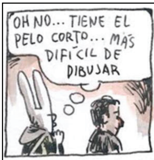
Figura 16 – Metalinguagem na entrevista com Andrés Calamaro (1).

Em uma das cinco entrevistas analisadas, essa postura fica bastante evidente. No encontro com Calamaro, Liniers logo nota o corte de cabelo do músico e, a partir daí, começa a questionar como poderia fazê-lo reconhecível nos desenhos.