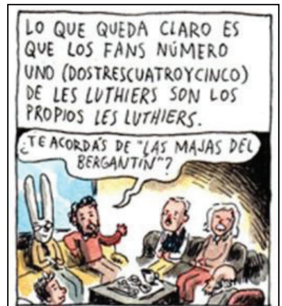
Figura 19 – Posicionamento de Liniers na entrevista com Les Luthiers.

Liniers não resguarda suas opiniões. Pelo contrário, transforma em desenho o que pensou durante as entrevistas. Nos exemplos a seguir, o quadrinista faz, através de recordatórios, uma análise do comportamento do grupo humorístico Les Luthiers e opina sobre os óculos escuros de Calamaro.