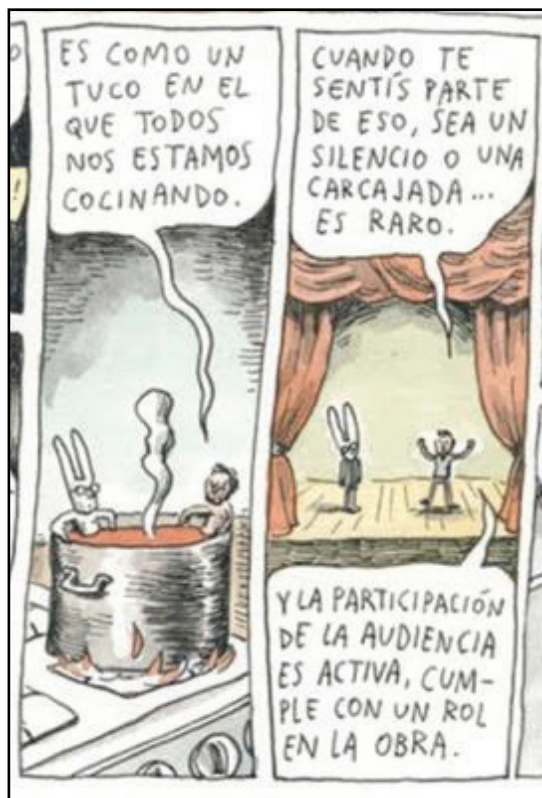
Figura 11 – Metáforas visuais na entrevista com Ricardo Darín.

Com Ricardo Darín, Liniers escolheu a metáfora para ilustrar algumas falas do ator, como quando ele fala sobre o significado do teatro.