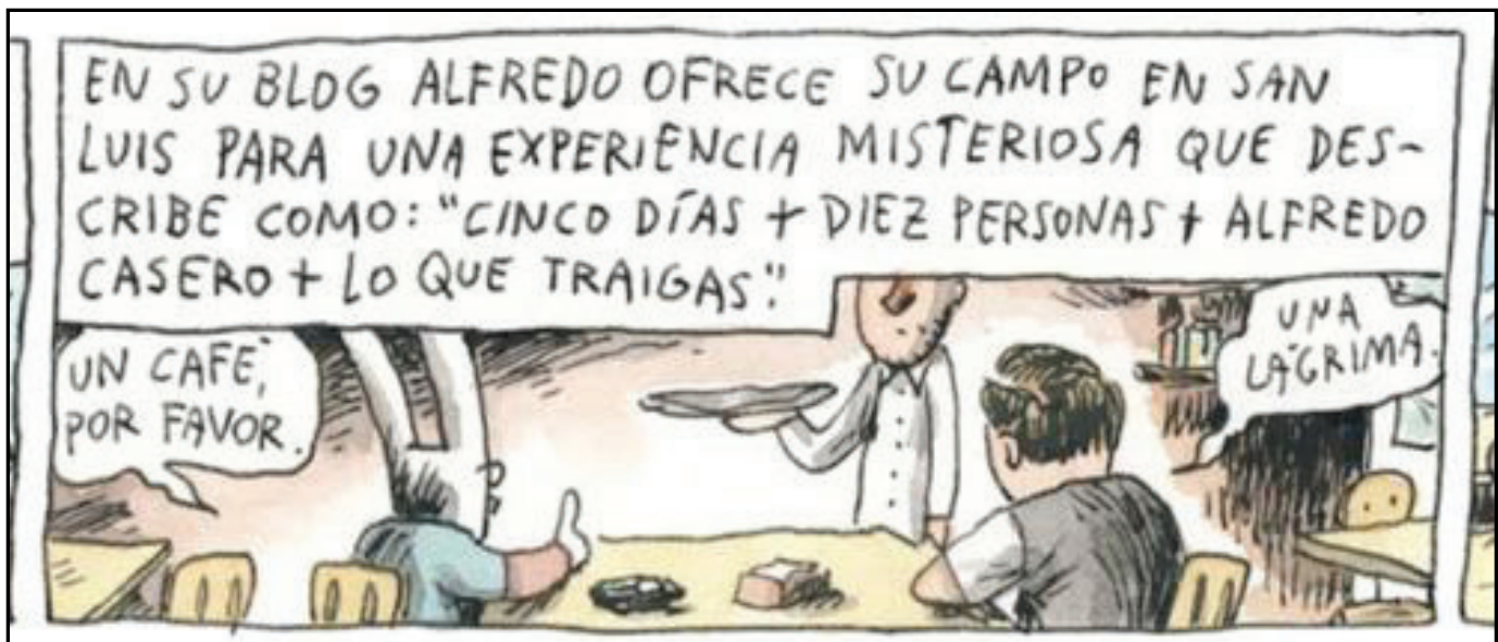
Figura 8 – Recordatório de contextualização na entrevista com Alfredo Casero.