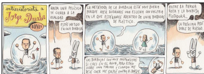
Figura 18 – Bônus da entrevista com Jorge Drexler.

Liniers desenha suas entrevistas dessa maneira, o que resulta em outro fator de demarcação da personalidade do entrevistador proporcionado pela linguagem dos quadrinhos. O traçado despojado fica ainda mais claro quando, depois da entrevista desenhada, há uma tirinha que funciona como bônus informativo.