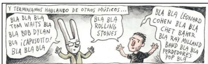
Figura 7 – Empatia na entrevista com Andrés Calamaro.

e podem servir para dar voz a um narrador – tanto para expressar subjetividade quanto para funções mais objetivas, como contextualizar o que está acontecendo naquele momento da entrevista ou explicar algo sobre o assunto discutido no quadrinho. Como nos quadrinhos seguintes, em que começa a entrevistar o ator Alfredo Casero.