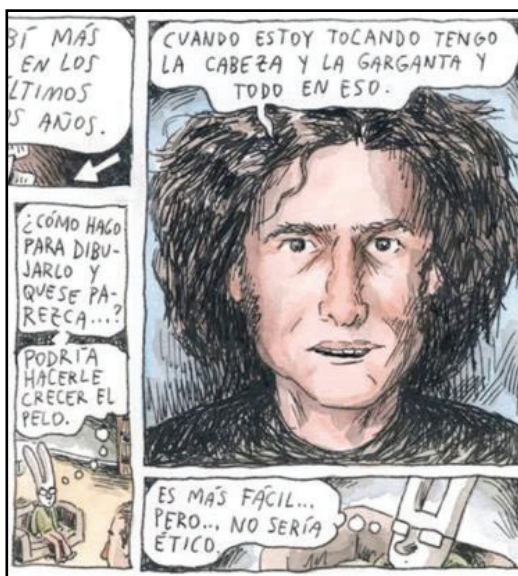
Figura 17 – Metalinguagem na entrevista com Andrés Calamaro (2).