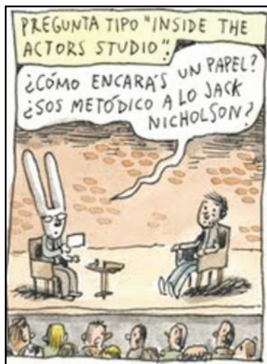
Figura 15 – Autoanálise do narrador na entrevista com Ricardo Darín (2).