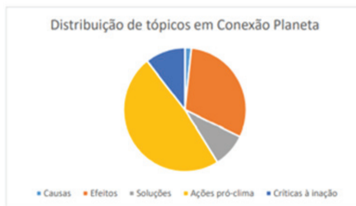
GRÁFICO 2 – TÓPICOS ACIONADOS POR CONEXÃO PLANETA AO LONGO DOS DOIS ANOS

Abaixo é possível ver a predominância de tópicos sobre ações pró-clima e efeitos, enquanto as causas continuam recebendo quase nenhuma atenção: