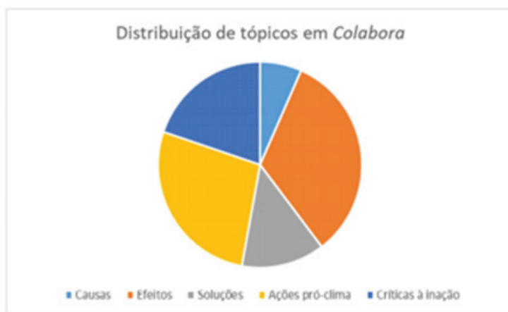
GRÁFICO 1 – TÓPICOS ACIONADOS POR COLABORA AO LONGO DOS DOIS ANOS

Observe que as causas correspondem ao tópico menos explorado e que os efeitos são aqueles temas prioritariamente destacados na cobertura: