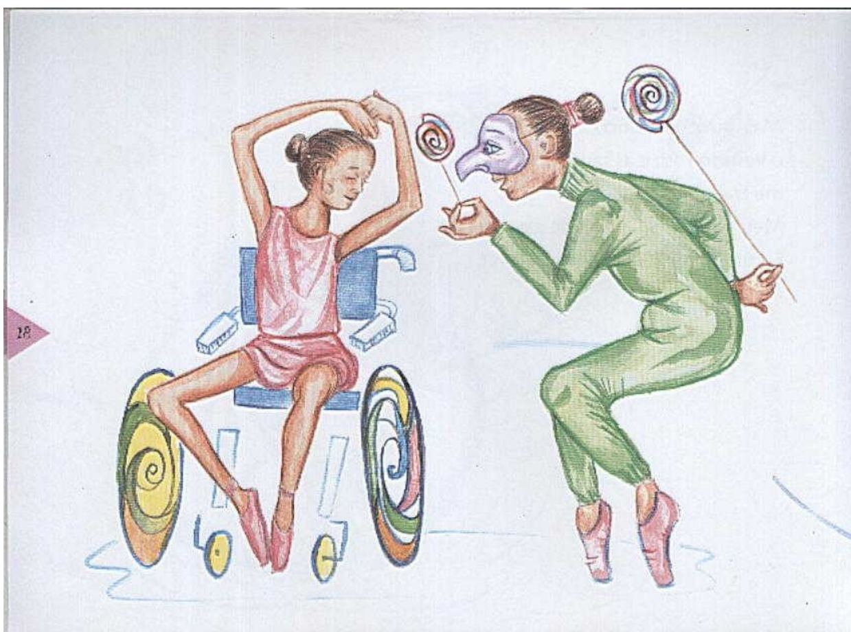
Ilustração de O giro da bailarina , de Keyla Ferrari Lopes.