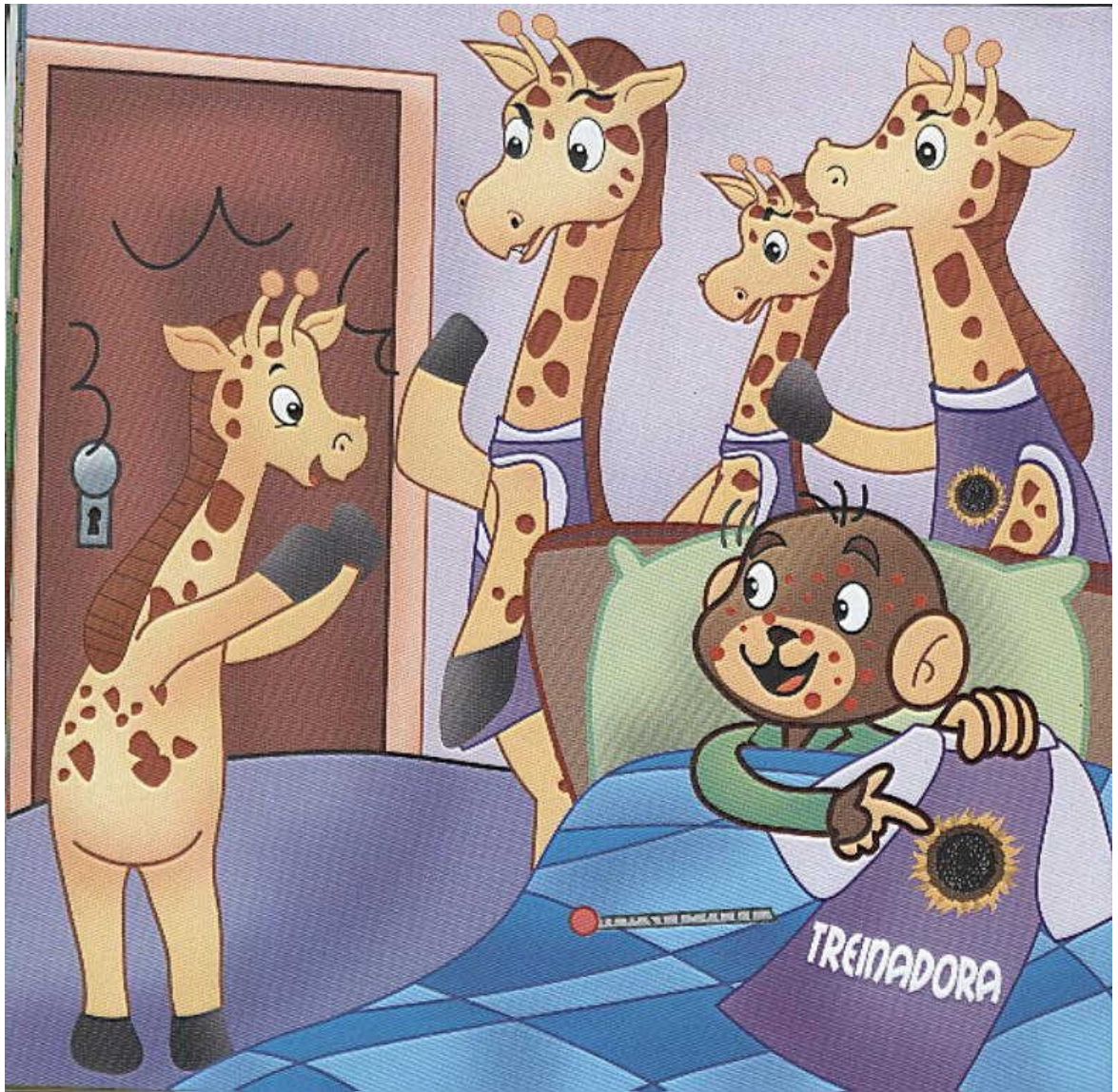
Ilustração de Nem todas as girafas são iguais , de Márcia Honora.