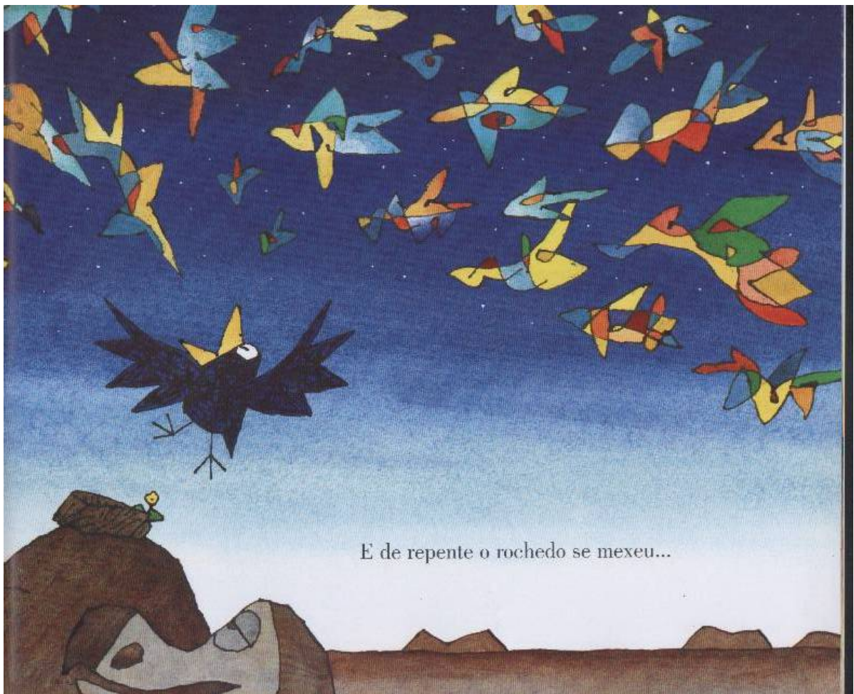
Ilustração de Igor: o passarinho que não sabia cantar , de Satoshi Kitamura.