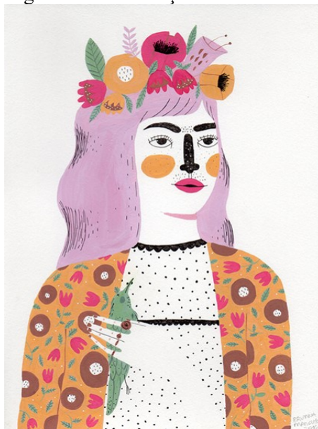
Figura 1: Na ilustração de Mancuso:

Fonte: MANCUSO, Bruna. As ilustrações de Bruna Mancuso mostram a força feminina com formas geométricas e botânica: Entrevista. 2016 1 .