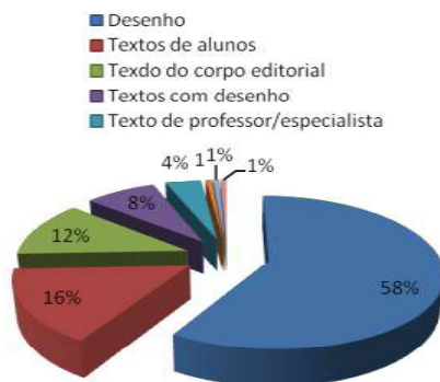
Gráfico 2: Distribuição proporcional das matérias cf. gênero.

A análise de conteúdo destas 152 matérias permitiu reconhecer seis principais dimensões/concepções referentes ao esporte. Embora não esteja no escopo deste texto a discussão sobre elas, consideramos relevante apontar ao