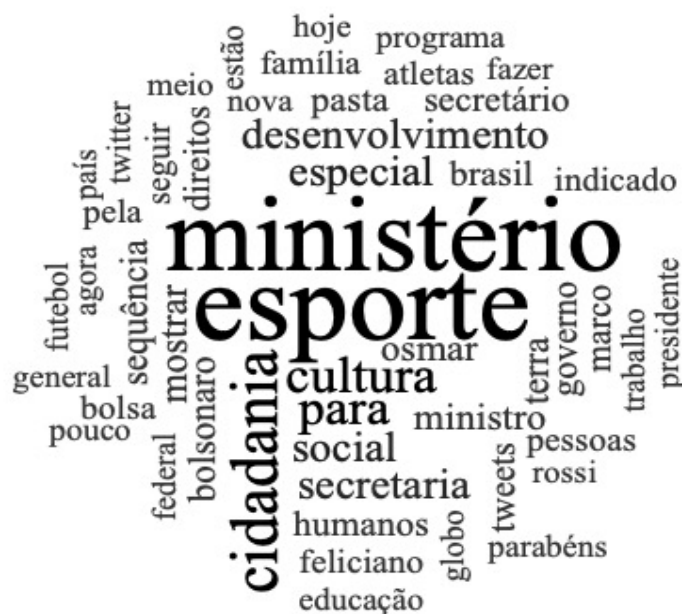
Figura 2 – Nuvem de palavras mais recorrentes nos tweets

Na visão geral, observa-se que a maior parte dos comentários dos tweets correspondem a uma diversidade de elementos. A figura 2 apresenta a nuvem das palavras que mais apareceram em toda a análise.