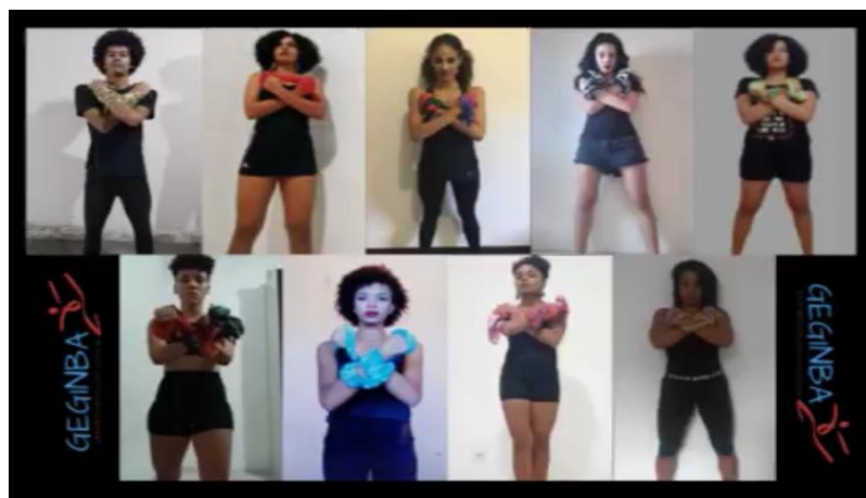
Figura 2 - Coreografia “Mundo Negro” - (GEGINBA/UFBA) – IX Festival Gymnusp.

A composição projetou indícios de um cenário cotidiano e artístico e atores responsáveis pela identidade e manutenção de expressões culturais locais. Aspectos constatados em Festivais de GPT, onde muitos grupos utilizam a cultura popular brasileira como tema central de suas produções.