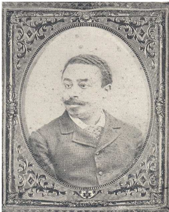
Figura 1: Zenón Rolón

Fonte: Historia de la música en la Argentina , de Vicente, 1961.