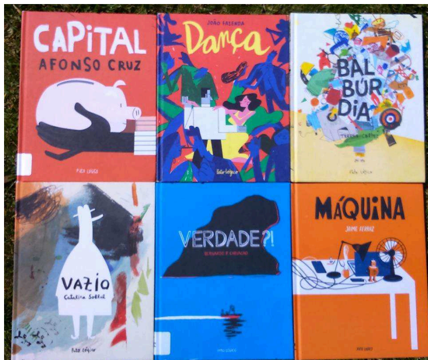
Figura 1 – Capas da coleção

Partindo desses pressupostos e da reflexão mais atual sobre as tendências da edição de livros-álbum, visando dar conta das especificidades que os caracterizam, em termos de conceção e possibilidades de leitura, o presente artigo analisa, do ponto de vista da construção, seis volumes publicados na coleção “Imagens que contam”, da editora portuguesa Pato Lógico, entre 2014 e 2017, cuja particularidade reside, justamente, na edição de obras onde as imagens substituem as palavras e está ausente todo o texto impresso (à exceção do título e, em última instância, dos créditos editoriais), apresentando aspetos visuais e/ou (tipo)gráficos comuns, que sugerem pistas de leitura e merecem ser alvo de estudo e reflexão. Desse modo, pretende-se, com recurso da leitura comparada dos vários volumes, identificar o impacto dos peritextos na construção de sentidos, analisar a organização das várias narrativas e refletir sobre os temas e motivos dominantes, com vista a compreender a unidade e coerência que caracteriza a coleção, claramente original no panorama literário português, até pela pluralidade de leituras que promove.