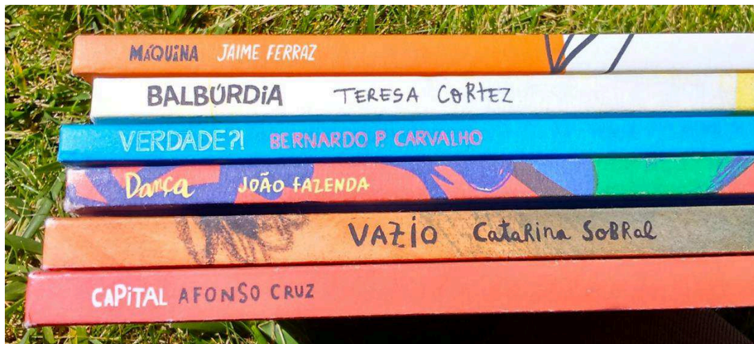
Figura 2 – Títulos

visual proposta na capa do livro-álbum Vazio (SOBRAL, 2014a), onde a centralização da silhueta branca-protagonista e a disposição do título no seu interior poderão indiciar o processo de maturação experienciado pela personagem.