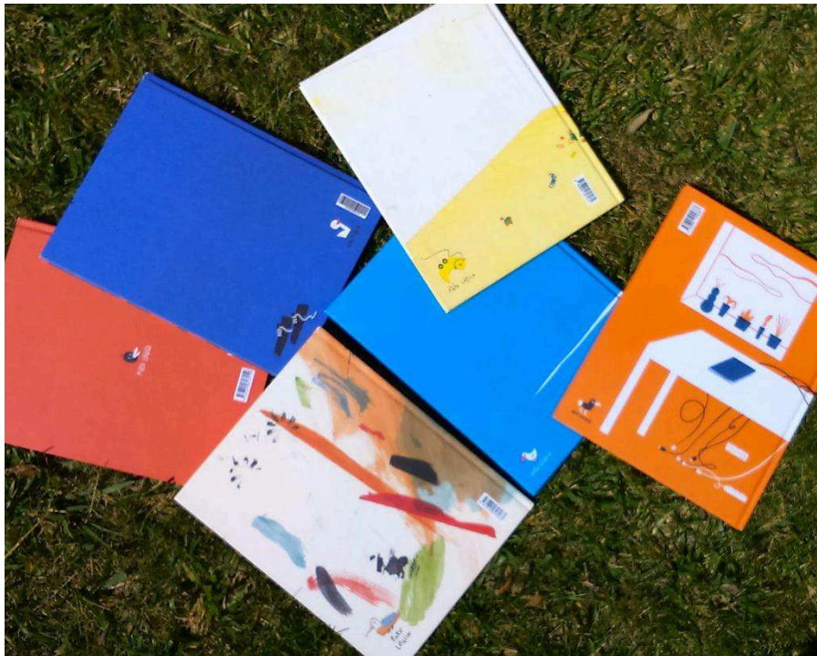
Figura 3 - Contracapas

Ressalva-se, ainda, ao nível do arranjo gráfico desses peritextos, concretamente na escolha e colocação espacial das ilustrações e dos títulos, os jogos de planos e perspetivas, com focalizações e impactos visuais distintos consoante as propostas (e a intencionalidade dos seus criadores). Atente-se, por exemplo, na opção pelo plano geral na capa do livro-álbum Verdade?! que põe em relevo a relação espacial entre as personagens e o próprio cenário, antecipando uma visão panorâmica da narrativa.