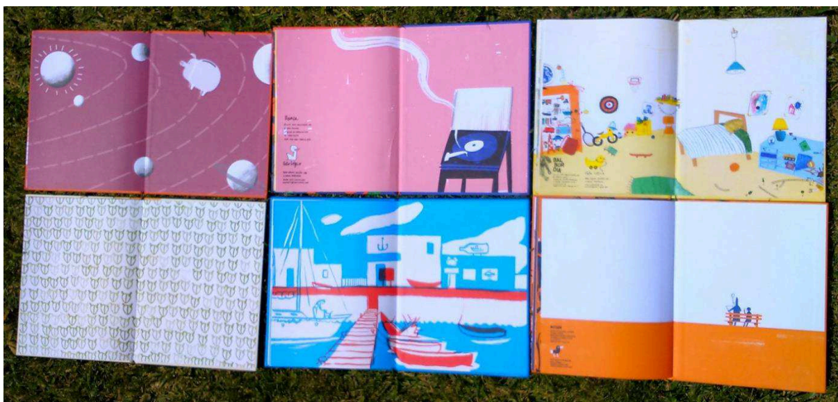
Figura 5 - Guardas finais