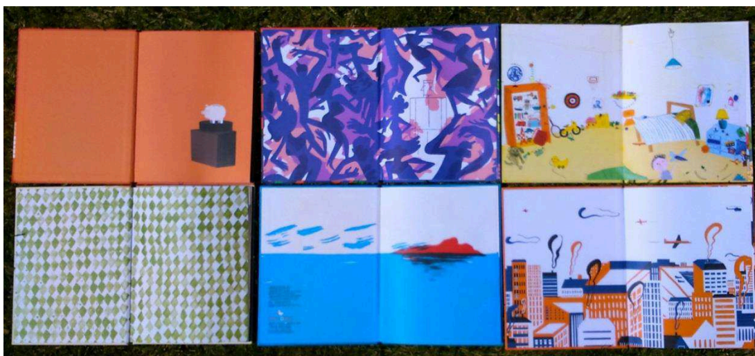
Figura 4 - Guardas iniciais

Em suma, esse peritexto confirma o seu relevo na produção editorial contemporânea, constituindo um espaço que não só assegura a transição visual entre o exterior e o interior do livro, como pode assumir funções narrativas privilegiadas, assegurando a abertura e o fecho da própria narrativa (e.g., Verdade?! , Balbúrdia e Máquina ), ou procedendo à sua releitura simbólica (e.g., Capital , Dança e Vazio ). Mais ou menos desafiadoras e instigantes do ponto de vista da construção de hipóteses interpretativas e da realização de antecipações que a leitura e a exploração dos volumes poderão confirmar, as guardas exprimem ainda o cariz experimental, no sentido laboratorial do termo, desse tipo de elementos, onde os autores põem à prova a sua criatividade.