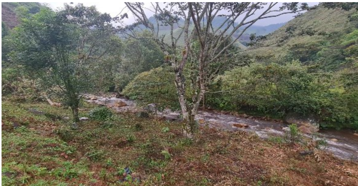
Fotografía 7 — Río en el que aparece el duende verde