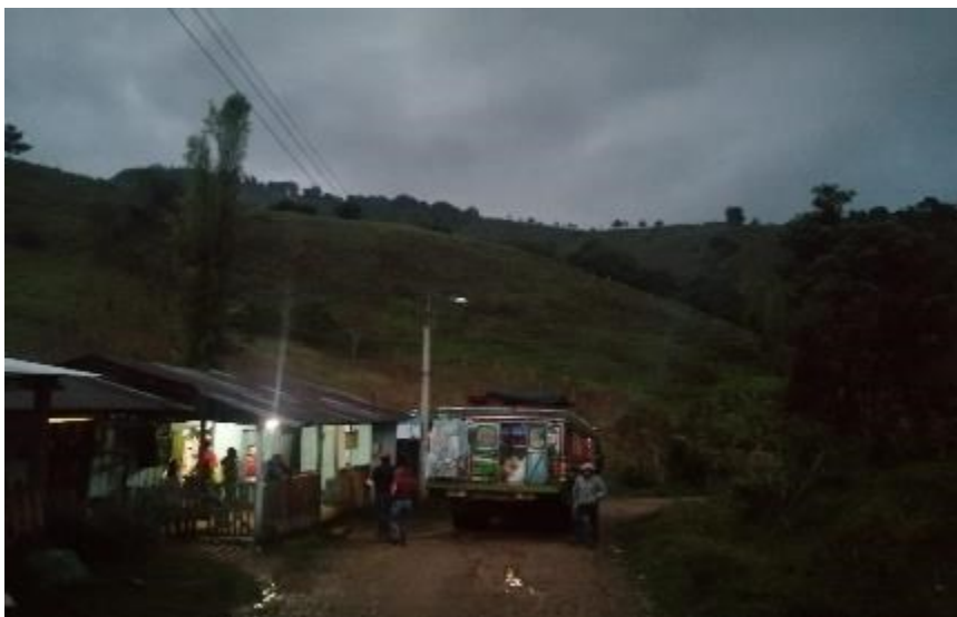
Fotografía 3 — Poblado al borde de la vía terciaria Neiva-Baraya