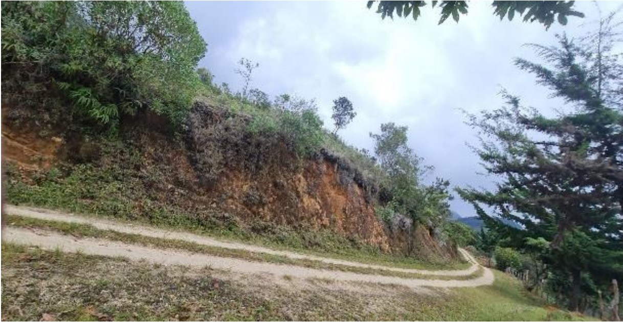
Fotografía 6 — Vía terciaria de acceso al municipio de Baraya