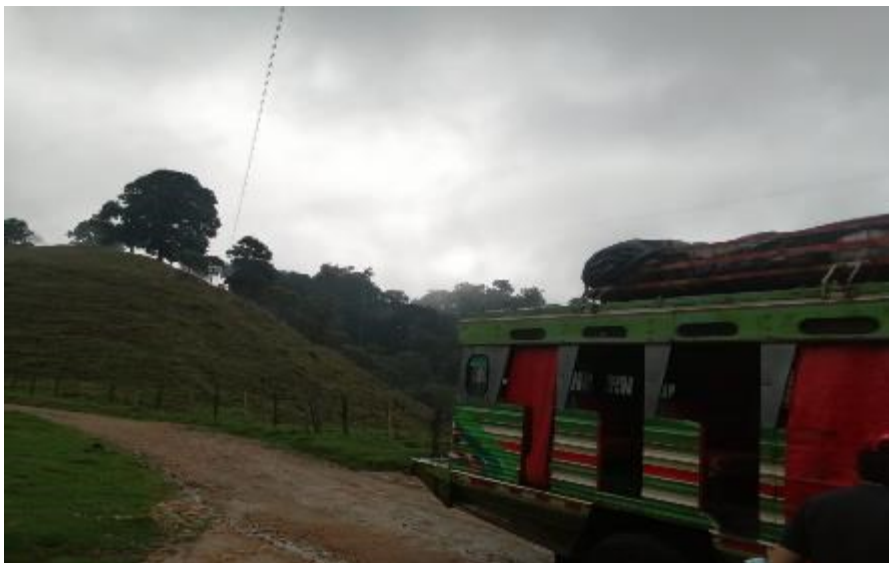
Fotografía 2 — Vía terciaria destapada Neiva-Baraya