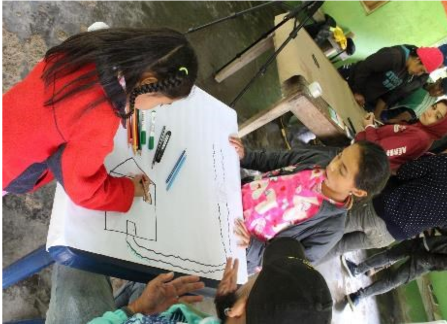
Fotografía 9 — Construcción de saberes y memorias a través de mapas vivenciales por los niños y niñas