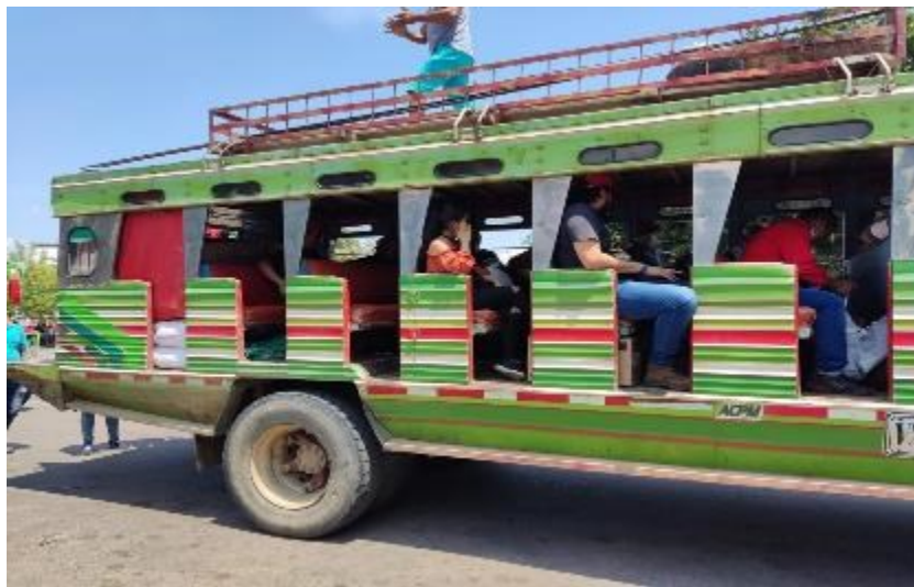
Fotografía 1 — Chiva, Transporte público rural en Colombia