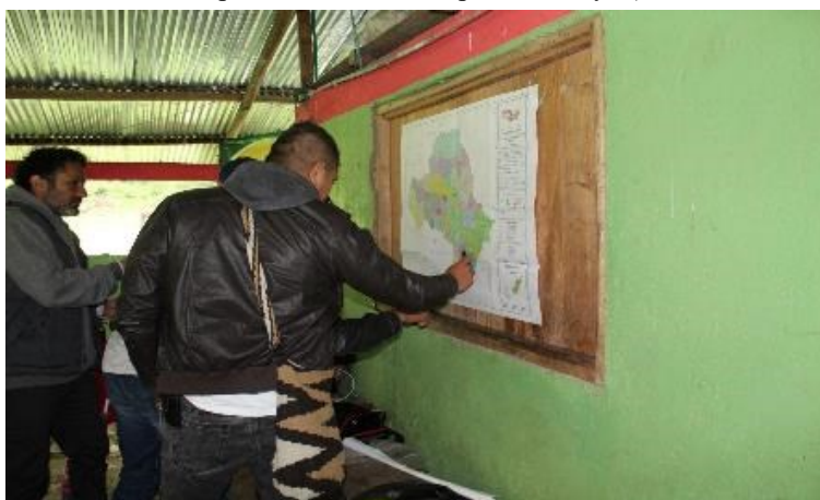
Fotografía 4 — Lectura del Mapa oficial del municipio de Baraya (Gobernación del Huila, 2019).