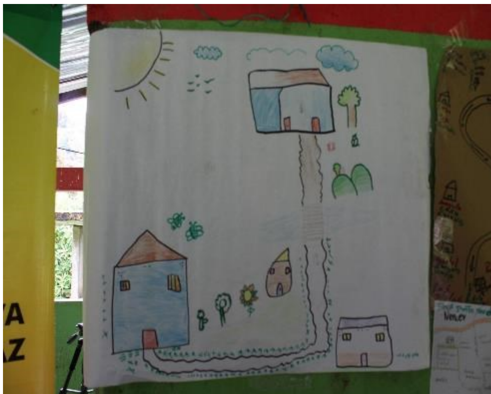
Fotografía 8 — Mapa de la comunidad realizado por los niños y niñas