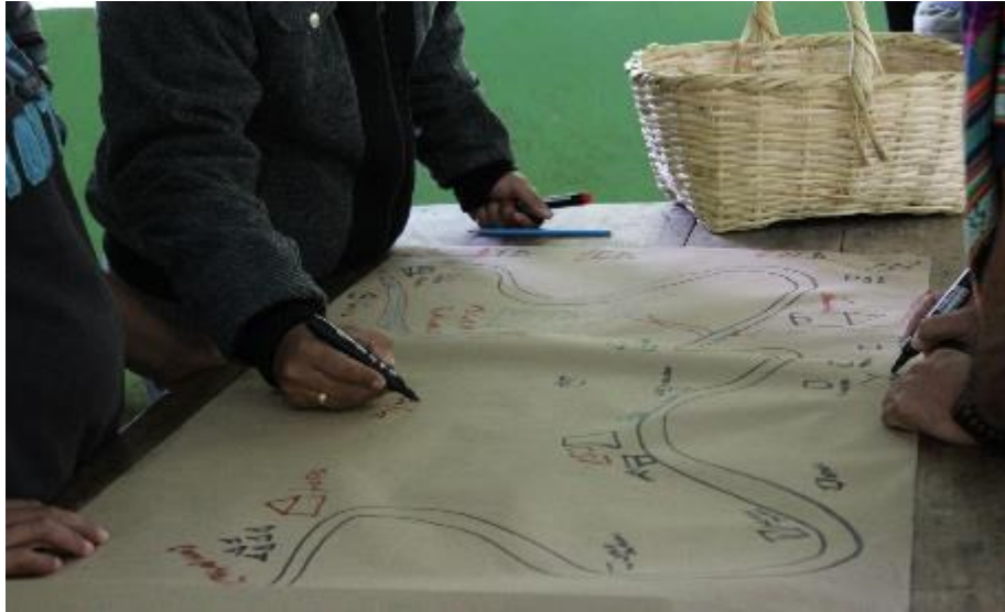
Fotografía 5 — Construcción del mapa vivencial del territorio