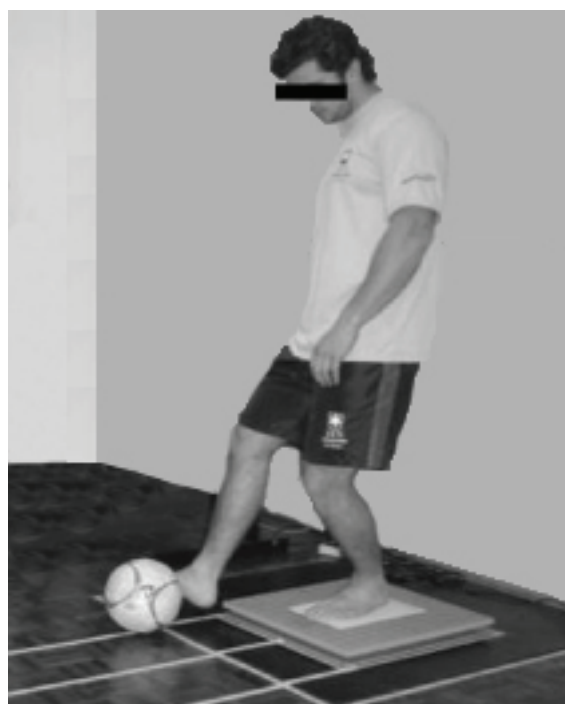
Figura 1. Atleta executando a avaliação estabilométrica.

Os dados foram coletados com frequência de amostragem de 100 Hz e foram selecionados três segundos referentes ao tempo necessário para execução do movimento de passe e restabelecimento da posição inicial para posterior análise, realizada sem qualquer processo de filtragem de sinal. Tendo em vista os objetivos do estudo, optou-se pela análise dos seguintes parâmetros mensurados na avaliação estabilométrica: 1) amplitude total de deslocamento do COP no eixo X (deslocamento médio-lateral, em cm); 2) amplitude total de deslocamento do COP no eixo Y (deslocamento ântero-posterior, em cm); e 3) velocidade média de deslocamento do COP nos três segundos de avaliação do movimento (em cm/s) 20 .