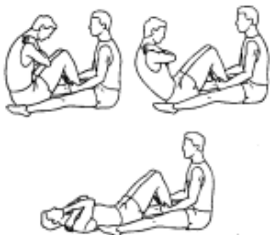
Figura 02: Ilustração do teste da AAHPER

O avaliado, ficou em decúbito dorsal, joelhos flexionados em um ângulo aproximado de 90°, com os braços cruzados à frente do corpo, as mãos sobre os ombros, a cabeça também deveria estar em contato com o solo e os pés firmes (fixos pelo avaliador) para que não perdessem o contato com o solo. O avaliado deveria flexionar o quadril até que os cotovelos tocassem as coxas e, ao tocá-las, voltar à posição inicial (um ciclo de movimento). Aos comando de advertência “atenção” e de execução “já” o avaliado realizava os movimentos. Não foi permitido descanso entre as repetições. O resultado foi obtido pelo maior número de ciclos completos de movimento realizados em 30 segundos.