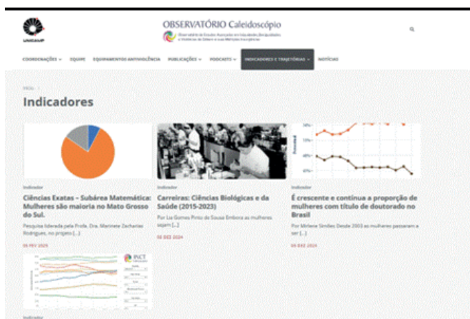
Figura 2 – Print de tela do site do Observatório Caleidoscópico