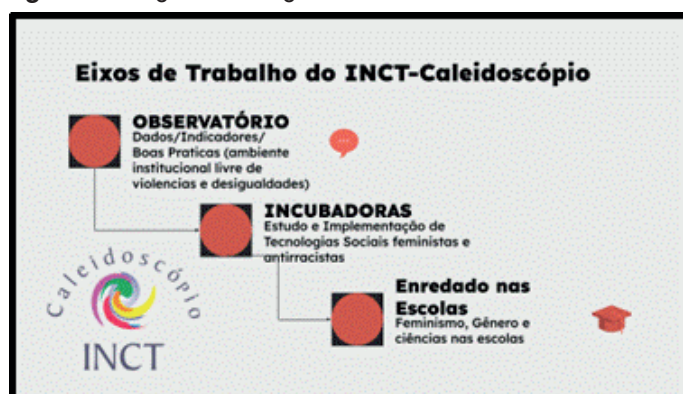
Figura 1 – Infográfico de alguns dos eixos de trabalho do INCT Caleidoscópico

O princípio balizador do INCT Caleidoscópico, além do engajamento com a construção de epistemologias feministas, transfeministas, decolônias, antirracistas e anticapitalistas, é a troca de experiências intergeracionais e interdisciplinares. O foco do trabalho é o mapeamento das iniquidades, desigualdades e violências de gênero e sexualidade, mas não apenas isso. Alinhadas às críticas de Schiebinger (2001), que apontam os limites da quantificação como única estratégia de transformação, entendemos o Caleidoscópico como Instituto que articula a leitura dos dados a intervenções políticas e pedagógicas concretas.