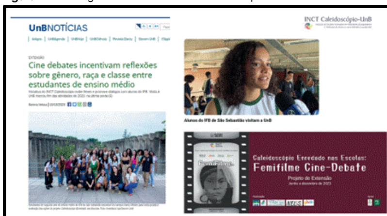
Figura 4 – Montagem de mídia sobre o Caleidoscópio Enredado nas Escolas