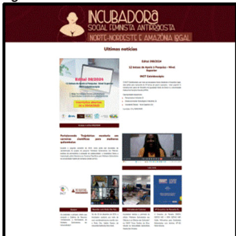
Figura 3 – Print de tela do site da Incubadora Norte-Nordeste do INCT Caleidoscópio