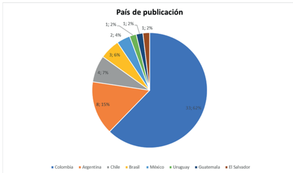
Gráfico 3 - País de publicación