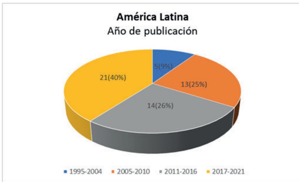
Gráfico 1 - Producción bibliográfica en América Latina según año de publicación