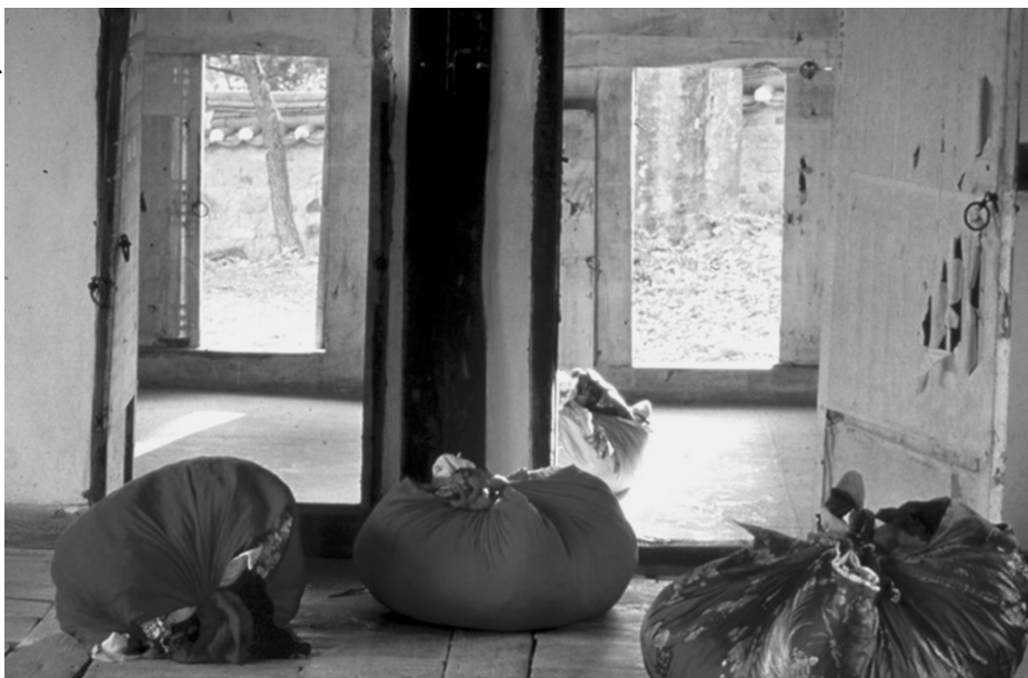
Deductive Object, 1994 Used clothes bed covers