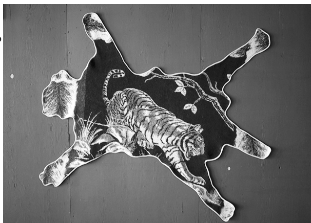
Tiger, 2001 Old blanket, Lycra, 7'5" courtesy of the artist and LMCC, NY