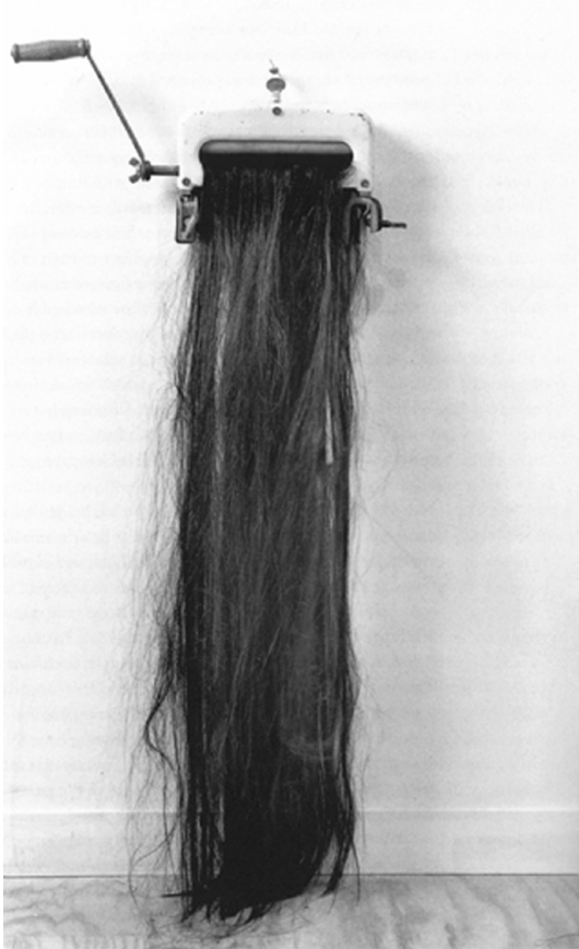
Wrung 1992, washer part, synthetic hair, nails, 12"42"/3"