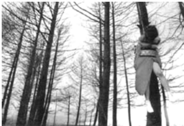
FIGURA 12 – Protesto de feministas contra a pornografia, com a ênfase de que não se opõem à nudez e à sexualidade