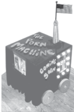
FIGURA 7 – The Porn Machine