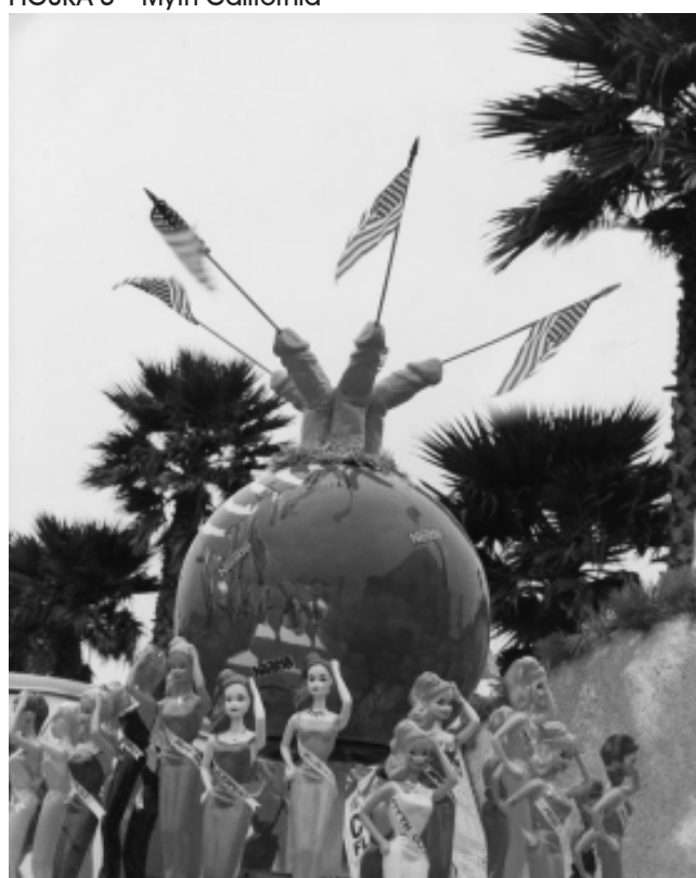
FIGURA 5 – Myth California