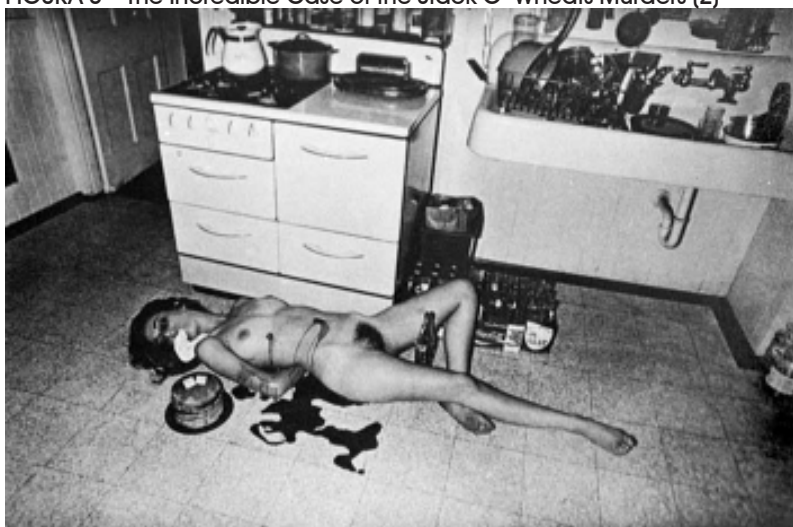
FIGURA 3 – The Incredible Case of the Stack O´Wheats Murders (2)

“As poses revelam muito menos acerca da luta e da rendição, do que da provocação e sensualidade”.