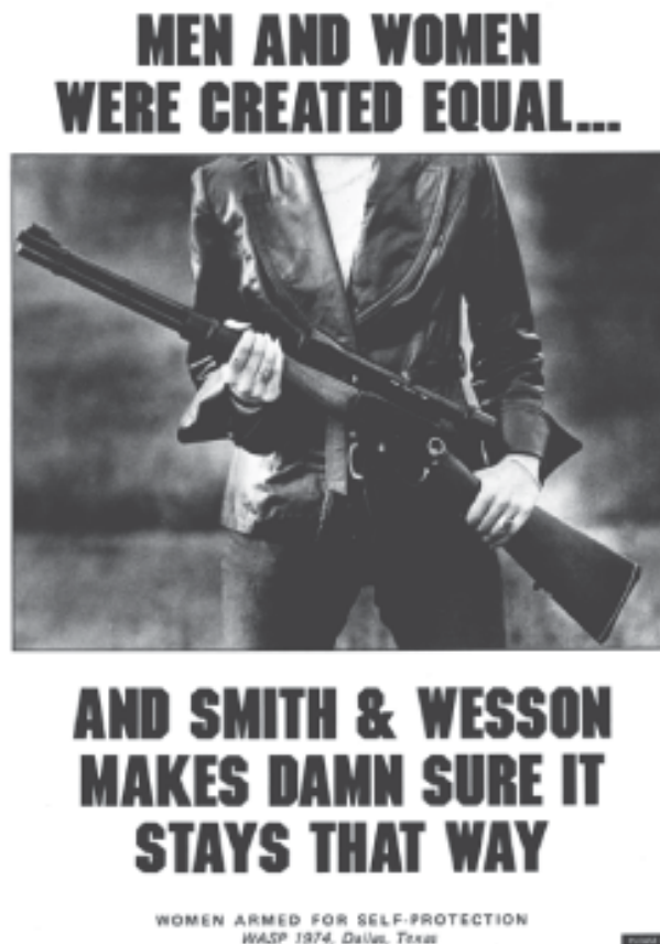
FIGURA 1 – Cartaz da Women Armed for Self Protection (WASP)