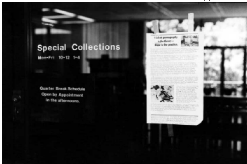
FIGURA 2 – The Incredible Case of the Stack O´Wheats Murders (1)