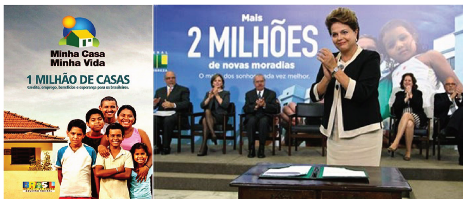
Imagem 1: Material publicitário da fase 1 e fase 2 do programa MCMV

À esquerda, capa da primeira cartilha do programa MCMV, editada pela Casa Civil e distribuída pela CEF; à direita, foto oficial da promulgação do MCMV 2. Em ambas imagens, a ênfase na “meta física” de produção é evidente.